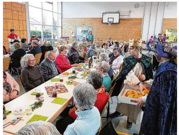
Eine schöne Tradition: Die Sternsinger beim Verteilen der Hefesterne.