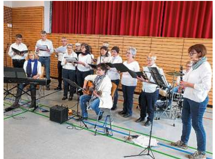
Der Chor Maranatha sang sich in die Herzen der Senioren.