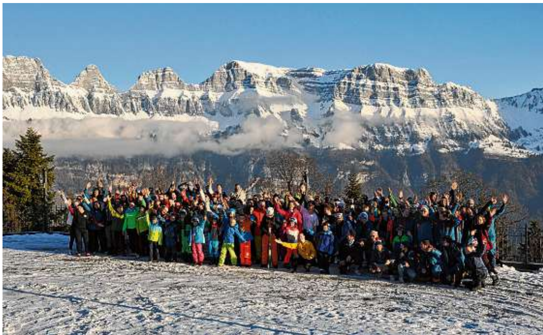
Gruppenbild aller Teilnehmer vor dem imposanten Ausblick auf die Churfirnen.

Neues Jahrzehnt, Knallerstimmung und jede Menge Spaß im Skikurs