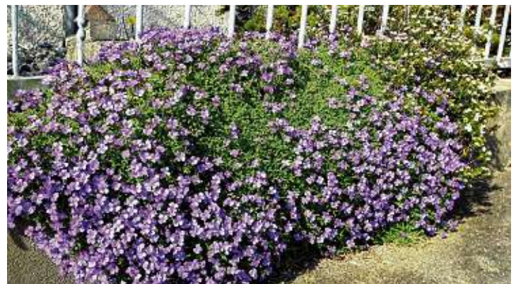
Prächtige Blaukissen ziehen die Blicke auf sich.

Auch wenn die Experten zum momentanen Zeitpunkt Ostern als die magische Grenze sehen, ab da alles anders werden könnte, wird Ostern 2020 als Familienfest mit Ostereiersuchen im Garten gemeinsam mit den