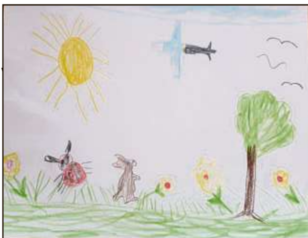
Dieses Bild zum Thema „Frühling“ schickte uns Noel