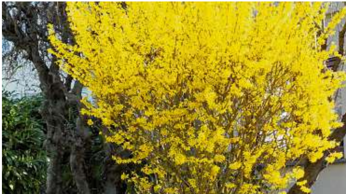
Das strahlende Gelb der Forsythie macht Lust auf den Frühling.

saftigen Lamm- oder Rinderbraten, wobei ein edler Tropfen das perfekte Ostermenü abrundet. Auch einem Osterspaziergang ins Grüne steht höchstens schlechtes Wetter im Wege. Zu guter Letzt noch ein Tipp, der trotz Corona nichts von seiner positiven Wirkung verloren hat: Ein Gottmadinger Geschenkgutschein lässt sich nicht nur gut in einem Osternest verstecken. Mit ihm liegt man immer richtig und er bringt auch per Post Freude für den Beschenkten beim späteren Einkauf..