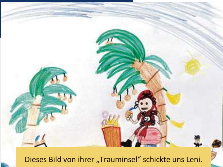
Dieses Bild von ihrer „Trauminsel“ schickte uns Leni.

Rechenpyramide: Rechne immer die benachbarten Felder zusammen (plus) und schreibe das Ergebnis in das darüberliegende Feld, bis du ganz oben bist. Lösung am Ende der Seite.