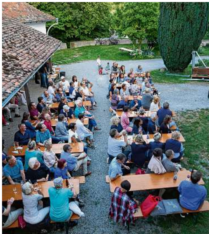
Schon 2018 lauschten die Zuschauer gebannt der Wiener Gruppe »Fräulein Honer«.

Gottmadingen. Dem Förderkreis für Kultur und Heimatgeschichte Gottmadingen bleibt nichts anderes übrig, als die für diesen Sommer (4. Juli bis 6. September) geplante und sich in Vorbereitung befindliche »EXPERIMENTELLE 21« für dieses Jahr abzusagen. Nicht nur, dass unvorhersehbar ist, ob die angedachte Eröffnung auf Schloss Randegg am 3. Juli einschränkungsmäßig überhaupt durchführbar wäre, sondern auch die Unmöglichkeit, in die Nachbarländer Schweiz, Österreich und Frankreich zu kommen, in deren Städten Thayngen, Amstetten und Selestat die Dependancen der »Experimentelle« vorgesehen waren, zwingen die Verantwortlichen zu diesem Schritt. Das ist im ersten und vielleicht auch zweiten Moment frustrierend. Die Reaktion darauf ist aber auch schon klar formuliert: Es wird weiter geplant, weiter vorbereitet, weiter am Rahmenprogramm gebaut (auf Schloss Randegg sollten das Niederösterreichische Streicher-Sextett, das Hegauer Trio »Kl3zm3reik«, die Gruppe »Fräulein Hona« aus Wien zusammen mit der Band »Hands&Bits« und zum Abschluss die »Feierware Jazzband« auftreten). Es wartet die »EXPERIMENTELLE 2121« (die 21. im Jahr 2021), denn unterkriegen lässt sich diese europaweit einmalige »Wanderer«-Ausstellung sicher nicht. Nicht die Bilder und Skulpturen gehen auf Wanderschaft von Ausstellungsort zu Ausstellungsort, sondern die Betrachterinnen und Betrachter sind dazu eingeladen und aufge-