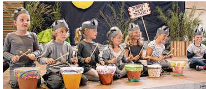
Die Kinder haben sichtlichen Spaß am Musizieren.

Neue Kurse an der Jugendmusikschule Westlicher Hegau ab Oktober