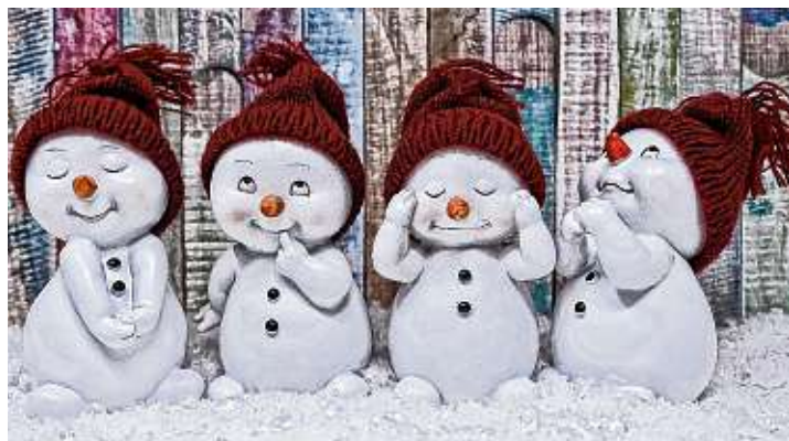
Von putzig bis elegant – die Auswahl ist groß.