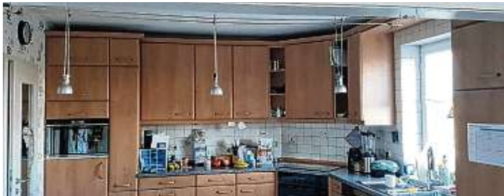
So sah die Küche vorher aus.