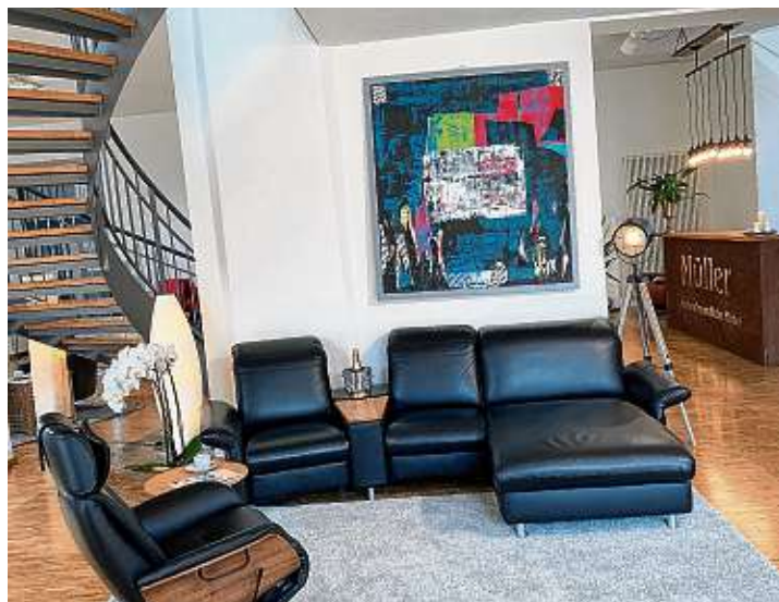
Entspannt arbeiten oder gemütlich abhängen, mit den richtigen Möbeln geht das.