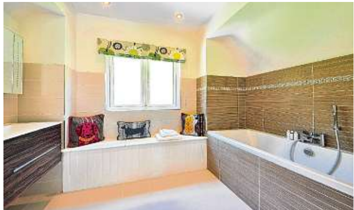
Im Bad geht es nicht nur um Funktionalität, sondern auch um Wohlfühlen.

dem man sich ganz auf sich konzentrieren kann. Aber auch der klassische Landhausstil kann in der richtigen Ausführung dem eigenen Geschmack entsprechen und zum Verweilen, Entspannen und Verwöhnen einladen. Die Profis aus den Fachgeschäften helfen einem da gerne, seinen eigenen Traum vom Traumbad zu verwirklichen.