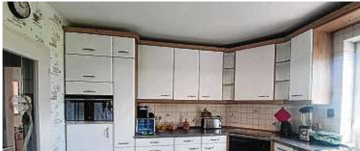
Das Ergebnis kann sich sehen lassen.