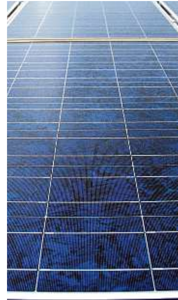
Photovoltaikanlagen sind so beliebt wie nie. Nach Meinung des BSW muss der Gesetzgeber aber im Neuen-Energien-Gesetz nachbessern.

bremse. Komme es im Bundestag im November nicht zu erheblichen Nachbesserungen am Gesetzesentwurf, werde der Ausbau von Solardächern im kommenden Jahr stark rückläufig sein. Der BSW kritisierte in diesem Zusammenhang insbesondere einen geplanten Systemwechsel bei der Vergabe von Marktprämien hin zu Ausschreibungen, vom Bundeswirtschaftsministerium vorgesehene kostentreibende Anforderungen des Messwesens für Kleinanlagenbetreiber sowie die nicht EU-rechtskonforme Belastung selbst verbrauchter Solarstrommengen mit der EEG-Umlage. »Werden diese Marktbremsen nicht gelöst, könnte sich die neu installierte Solardachleistung 2021 halbieren. Zudem droht die Außerbetriebnahme von über 10.000 Solarstromanlagen«, so Körnig.