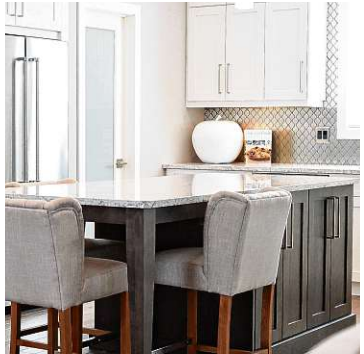
Die Kontraste bringen sich gegenseitig gut zur Geltung.

weiße Flächen dazwischen sind, matter Edelstahl für die Armaturen wirkt besonders gut auf dunklen Arbeitsflächen, zum Beispiel in Anthrazit. Schlussendlich kommt es wie immer auf den individuellen Geschmack an. Wer sich unsicher ist, der ist am besten beraten, wenn er sich Beistand und Informationen beim Profi einholt. Dieser kann nicht nur bei der räumlichen Planung der Küche helfen, sondern auch bei Fragen zu Materialien, Farben und generellem Design. In der neuen Küche kann man dann Paul Bocuse nacheifern, der einst sagte: »Wenn ein Architekt einen Fehler macht, lässt er Efeu darüberwachsen. Wenn ein Arzt einen Fehler macht, lässt er Erde darauf schütten. Und wenn ein Koch einen Fehler macht, gießt er ein wenig Sauce darüber und sagt, dies sei ein neues Rezept«.