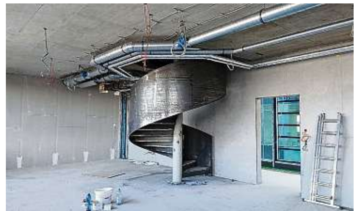
Das Lehrerzimmer ist auf zwei Etagen verteilt. Im 1. Obergeschoss ist die Kommunikationszone für Besprechungen und so weiter. Im 2. Obergeschoss befindet sich eine Art Großraumbüro mit 28 Arbeitsplätzen. Die beiden Ebenen sind durch diese interne Wendeltreppe verbunden.