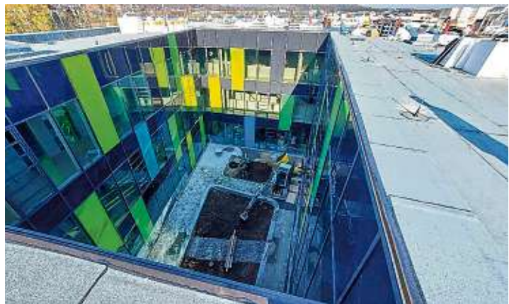
Die Innenhöfe sind mit einer Aluminiumfassade eingefasst. Die farbigen Flächen verleihen der Fassade eine interessante Struktur und eine angenehme Atmosphäre im Innenhof.