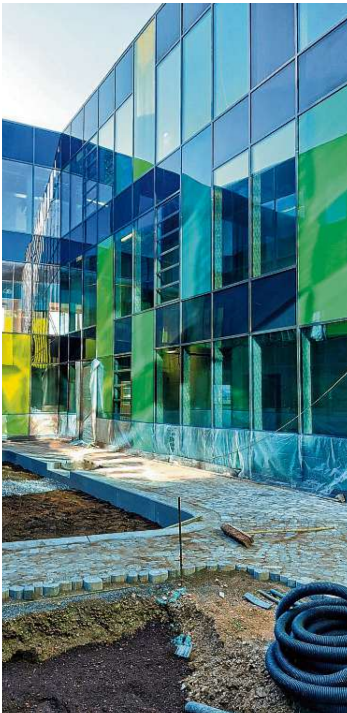
Die Innenhöfe mit den Pflasterflächen und Pflanzbeeten werden ebenfalls bis zu den Winterferien fertiggestellt. Diese Bereiche werden dann später von der Schule als »grünes Klassenzimmer« genutzt.