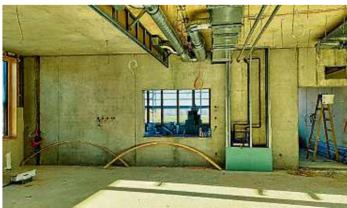
Die offene Lernlandschaft ist über ein Sichtfenster mit dem nebenliegenden Unterrichtsraum verbunden. Der linke Teil der Betondecke bleibt sichtbar; die Installationen im rechten Teil ab der Deckenschürze werden mit einer abgehängten Decke verkleidet.