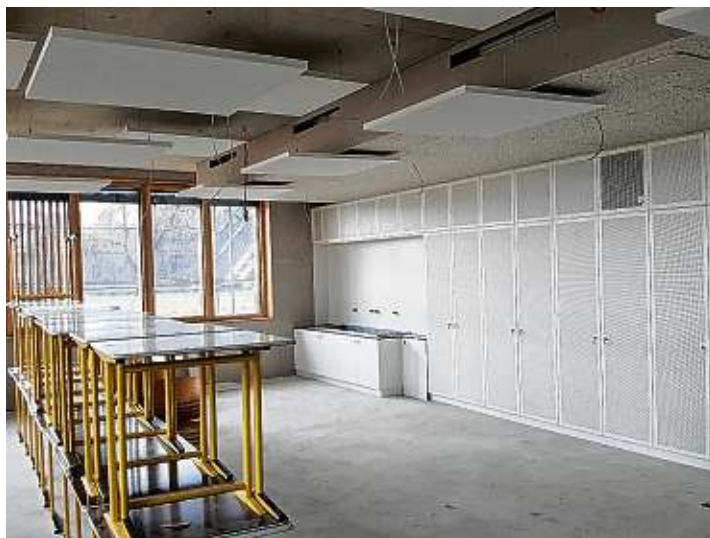
Das Musterklassenzimmer wird vorab fertiggestellt. Der erste Probeunterricht ist im Januar geplant.