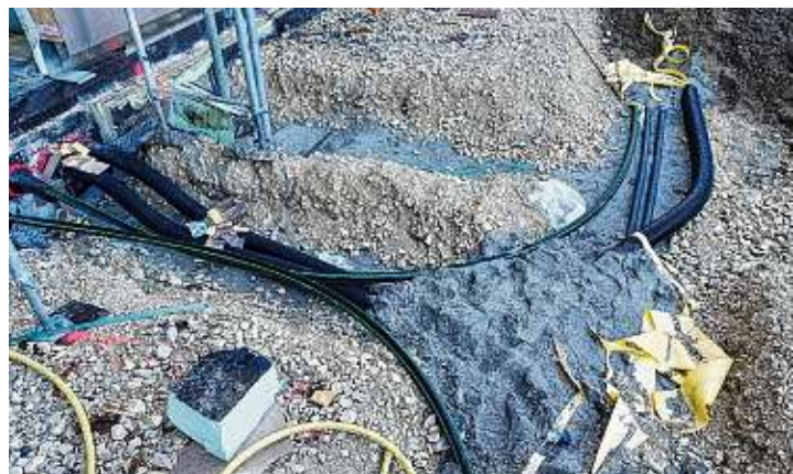
Die Versorgungsanschlüsse für die neue Schule sind verlegt. Für den zukünftigen Breitbandanschluss liegen zwei Leerrohre zur Rielasinger Straße und zum Namenlosen Weg. Dadurch kann auch auf zukünftige Entwicklungen reagiert werden.