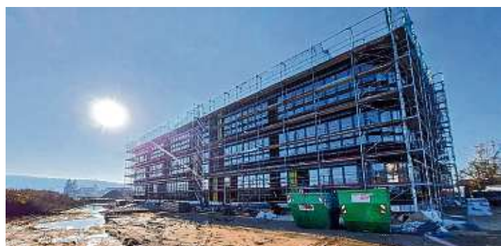
Mit die letzten Arbeiten werden der Landschaftsbau in den Außenanlagen sein. Der Auftrag wird noch in diesem Jahr erteilt, die Ausführung ist von März bis Juli 2021 geplant.