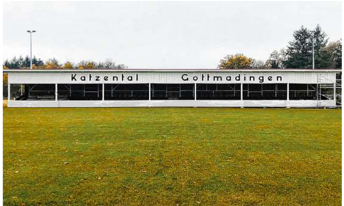
Die bekannte Holztribüne auf dem Katzental erstrahlt in neuem Glanz.

Gottmadingen/Bietingen. Die GoBi-Funktionäre haben es wieder getan, auch die zweite Zwangspause wurde kreativ genutzt. Auf dem Katzental steht nun eine fast runderneuerte Tribüne. Viel Herzblut, Einsatz und gute Ideen prägen die Sanierungsfortschritte. Es ist zwar weder die älteste und vielleicht auch nicht ganz die schönste noch Genutzte in Deutschland, aber sie prägt überaus eindrucksvoll die Sportanlage auf dem Katzental. Die neue Blende unter dem Dach mit dem wohlüberlegten Schriftzug waren die letzten Werke zur äußeren optischen Auffrischung. Am »Innenleben« wird wohl noch einige Zeit gewerkelt werden müssen. Unzählige Fußballfreunde in ganz Südbaden kennen sie. Beim Begriff »Katzental« hört man immer die gleiche Frage: »Das ist doch der Platz mit der alten Holtribüne«. Wann dort wieder gespielt werden darf, steht in den Sternen. Trainer Marius Nitsch bezeichnete die gelungene Video-Veranstaltung des Südbadischen Fußball-