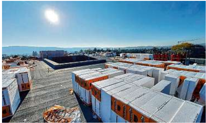
Mittlerweile ist ein Großteil des Dämmmaterials verarbeitet. Der gigantische Ausblick vom Flachdach bleibt später nur noch dem Hausmeister vorbehalten.