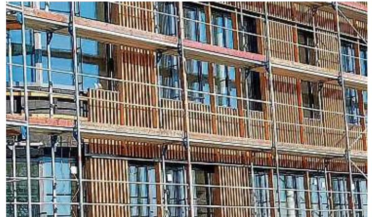
Die Holzfassade mit den Kanthölzern aus Lärchenholz ist bereits zur Hälfte fertiggestellt.