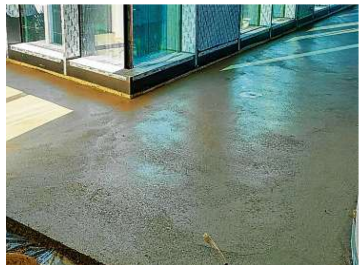
Der Estrich im 2. Obergeschoss ist bereits komplett fertiggestellt. Auch in den beiden anderen Geschossen wird bis zu den Weihnachtsferien der Estrich größtenteils eingebracht sein.