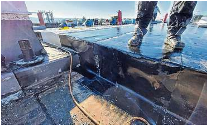
Das Flachdach erhält eine sogenannte Gefälledämmung. Die Dämmungsdicken (aus Polystyrol) variieren von 18 bis circa 60 Zentimeter.