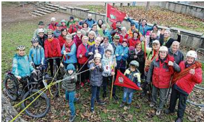
»Das sind Wir« – Aktivitäten bei den Naturfreunden der Ortsgruppe Gottmadingen.

Corona verhindert Veranstaltungen zum 100-jährigen Vereinsjubiläum