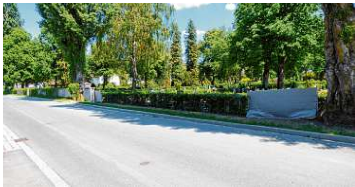
Ein Teil der Mauer fehlt bereits.