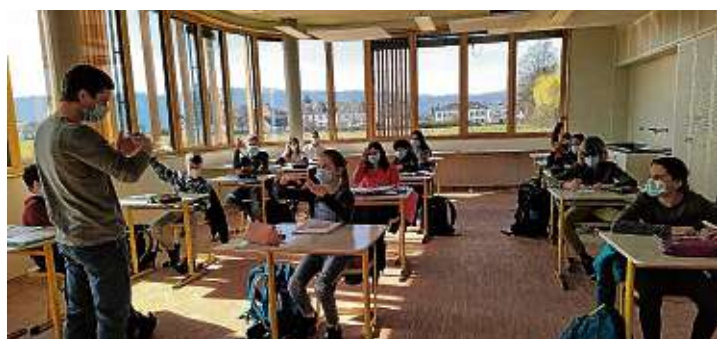
Die erste Unterrichtsstunde im neuen Schulgebäude.

kann auf den Flur schauen«. Die Wortmeldungen wollten nicht aufhören. Die Lehrer Raether sowie Newsham und Herzig versuchten alle Fragen zu beantworten und die Schüler erfuhren einiges über die lärmschluckende Deckenkonstruktion, das ausgeklügelte Heizungs- und Lüftungssystem, über Fenster, die man kippen oder öffnen kann, und die lärmschluckenden Schränke. Die Stunde war im Flug vorbei und man konnte spüren, dass die Kinder sehr beeindruckt vom Unterrichtszimmer, aber auch vom gesamten Bau mit seiner schönen Außenfassade und der abgerundeten Form waren und sich auf die neue Schule sehr freuen. Im anschließenden Gespräch mit zwei Schülern der Klasse stellte sich aber auch heraus, dass das alte Schulgebäude trotz Corona doch irgendwie noch ihre Heimat ist und sie es vermissen werden. Doch schnell wird im Sommer der Beginn im neuen Schulhaus sicher nach kurzer Zeit diese neue, moderne, lernfreundliche Schule allen Schülerinnen und Schülern der Eichendorff-Realschule zur neuen Heimat werden.