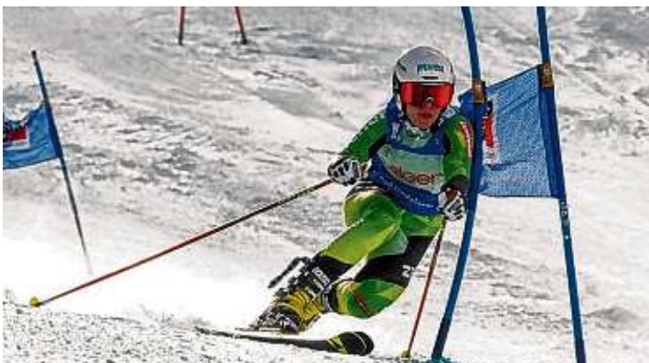
Viel Neuschnee sorgte für einen Tag Verspätung.

Ob im nächsten Winter Rennveranstaltungen möglich sein werden, ist aufgrund Ihres Studiums eher ungewiss.