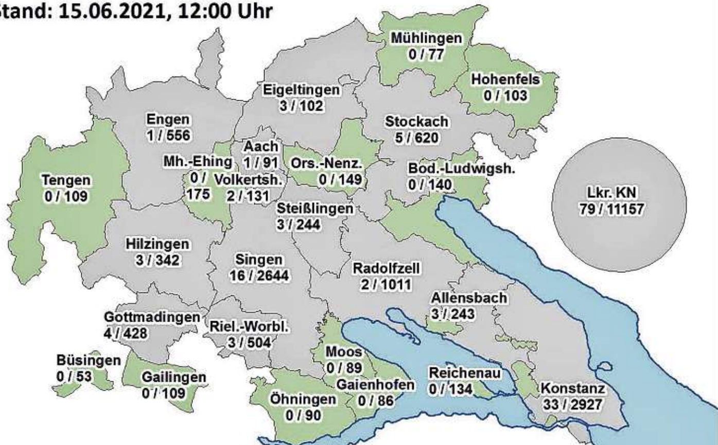
Grafik: Landratsamt Konstanz, Stand: 15. Juni 2021