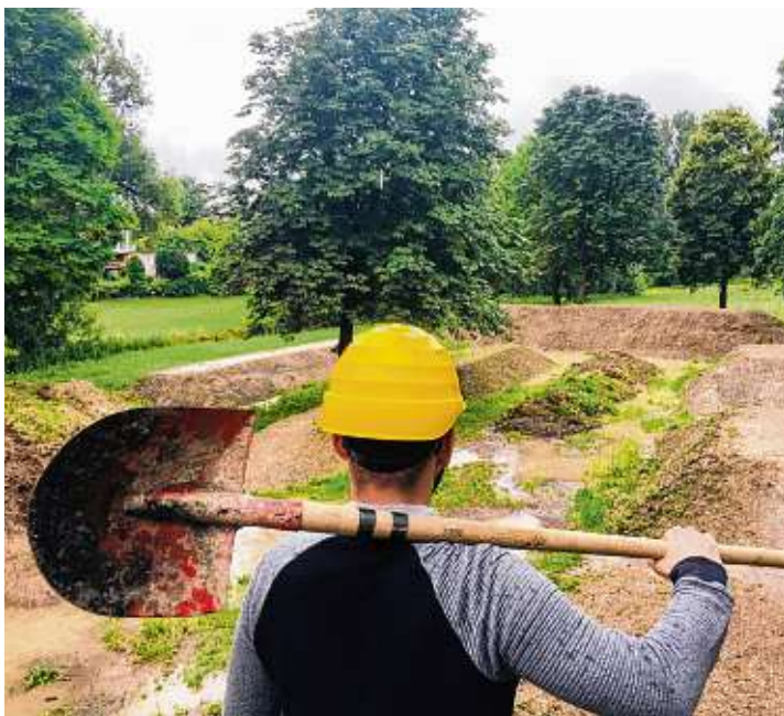
Jeder darf beim Bau des Dirt-Tracks helfen, sollte es zu viel sein, wird es nochmal zwei Termine geben.

Baustart des Dirt-Tracks ist am 29. und 30. Juli