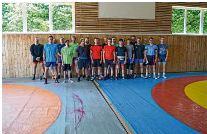
Die RHL Gottmadingen-Taisersdorf freuen sich auf die Zusammenarbeit.

Alle Sportler und Verantwortlichen sind zuversichtlich und motiviert und freuen sich auf die bald beginnende Saison. Die RHL Gottmadingen-Taisersdorf startet auch wieder am 14. August bei den Schweizer Freunden in Kriessern. Beim internationalen Grenzlandturnier treten 1.- und 2.-Liga-Vereine aus der Schweiz und dem benachbarten Österreich an. Die RHL möchte dieses stark besetzte Turnier als zusätzliche Vorbereitung und Standortbestimmung nutzen.