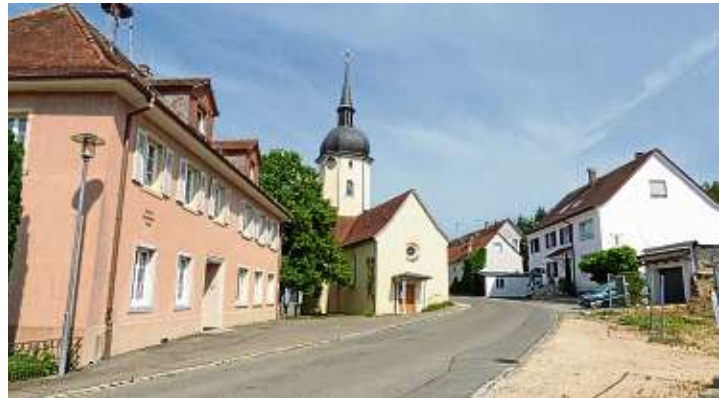
Der Bruder-Burkhard-Platz und die St.-Johannes-Kirche bilden den markanten Dorfmittelpunkt.

südlich verlaufende Autobahn ein Dorn im Auge ist, liegt Ebringen landschaftlich malerisch an der Nordwestecke des Heilsbergs. Das Dorf schmiegt sich an den Hausberg, mit einem unvergleichlichen Blick, etwa vom Afra-Brünneli aus. Johann Wolfgang von Goethe kam auf seiner dritten Reise in die Schweiz vorbei. Am 17. September 1797 schrieb er: »Ebringen. Nun geht es weiter über verschiedene fruchtbare Hügel; die höheren Berge sind mit Wald und Büschen besetzt. Viel Weinbau am Fuße eines Kalkfelsens, meist blaue Trauben, hingen sehr voll«. Dieser Weinanbau ist aber laut dem Buch »Geschichte von Ebringen im Hegau« in den 60er-Jahren »vollständig eingegangen«, auch der Obstbau sei eingegangen.