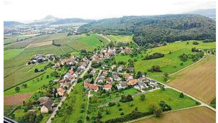
Idyllisch liegt Ebringen am Nordwest-Rand des Heilsbergs.

Von einer Eingemeindung nach Gottmadingen versprochen sich die Ebringer Bürger viel: