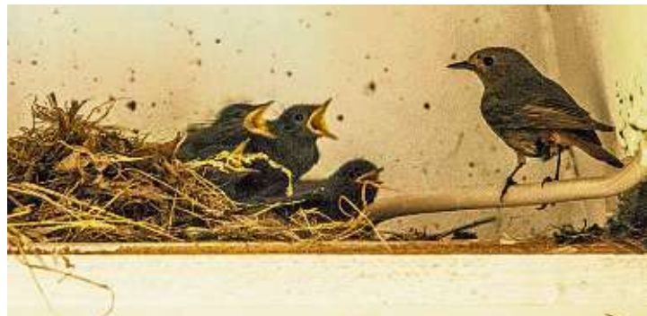
Die vier Küken sind schon fast flügge.

Einem erfolgreichen Start der vier Küken in die Eigenständigkeit steht nun nichts mehr im Wege. Ein paar Tage werden sie wohl noch für Gesprächsstoff an der Eichendorff-Realschule sorgen, bevor das Nest dann verlassen wird.