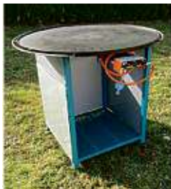
Mongolengrills, Schwenkgrills und Feuerschalen.