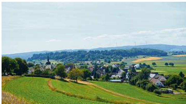
Vor 50 Jahren wurde Ebringen eingemeindet. Mehr dazu auf S. 8 und 9.

Damit werde laut Ley weiterhin gewährleistet, dass für gleiche Leistungen innerhalb der Gemeinde auch ein gleich hoher Beitrag – pro betreuter Wochenstunde – erhoben wird, ohne dass dabei die Individualität der einzelnen Einrichtungen darunter leidet.