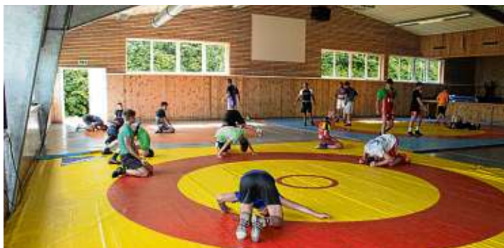
Die RHL Gottmadingen-Taisersdorf trainiert kräftig für die kommende Saison.

KSV Gottdingen und KSV Linzgau-Taisersdorf bilden Kampfgemeinschaft