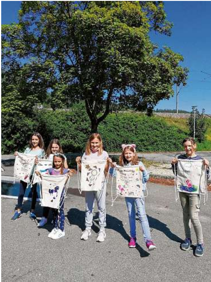
Besonders viel Spaß hatten die sieben Teilnehmerinnen bei dem Programmpunkt »Bemale deinen eigenen Turnbeutel« im Rahmen des Sommerferienprogrammes. Dort durften die Kinder die Turnbeutel nicht nur individuell bemalen, sondern auch Bügelbilder nach Wahl aufbügeln lassen und Perlen auf den Beutel stecken. So entstanden ganz unterschiedliche und wunderschöne Turnbeutel, die entweder selbst genutzt oder auch an Freunde verschenkt werden konnten.