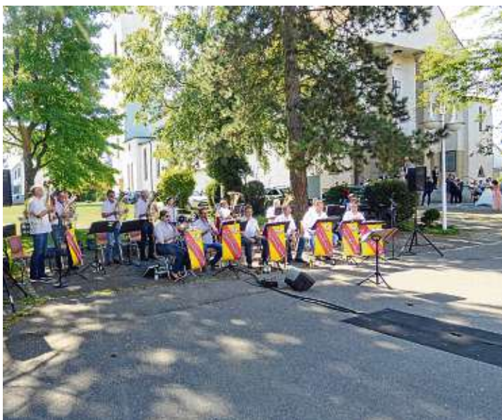
Für die Originalen Aussteiger war es eine Selbstverständlichkeit, beim Altenpflegeheim St. Hildegard aufzuspielen, und die Bewohner und die Tagespflege St. Martin freuten sich sehr über das Konzert bei bestem Wetter. Für die Hochzeit gab es noch ein kleines Ständchen.