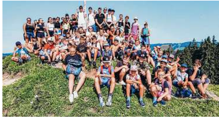
Die Kinder hatten viel Spaß im Sommerlager.

Der nächste Tag war der traditionelle Wandertag, an welchem die ganze Gruppe in die nächstgrößere Stadt wanderte. Daher wurden alle sehr früh geweckt und der Abmarsch konnte pünktlich erfolgen. Auf dem Weg ans Ziel wurde noch eine kleine Pause am Alpsee eingelegt, damit sich alle nochmals erfrischen konnten, denn es war ein sehr heißer Tag. Angekommen in Immenstadt, wurden leckere Fischbrötchen von der Küche verteilt, bevor zum Leitersuchspiel aufgebrochen wurde. Hier mussten die Kinder in Kleingruppen ein Rätsel lösen und nebenbei noch die Leiter, welche unterschiedliche Verkleidungen trugen, finden und anschließend fangen. Nachdem das Leitersuchspiel zu Ende war, wurde wieder der Rückweg nach Hause angetreten. Als alle dort ankamen, gab es eine kleine Überraschung. Ein ehemaliger Leiter kam nämlich zu Besuch und hat seiner Freundin einen Heiratsantrag gemacht. Als sie »Ja« gesagt hatte, wurde dies natürlich erstmal groß gefeiert und es gab erst sehr spät Abendessen. Deshalb war direkt danach auch schon wieder Nachtruhe und alle gingen glücklich schlafen. Mit Muskelkater in den Beinen wurde der nächste Tag begonnen. Dieser war der Mottotag, welcher dieses Jahr das Motto »Bauernhof« trug. Zuerst gab es ein ordentliches Bauernfrühstück, bevor man sich auf den Kampf gegen die anderen Bauernhöfe vorbereitete. Es gab am Morgen