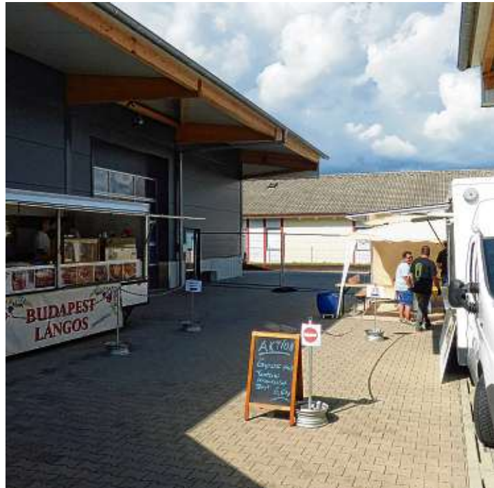
Neben ungarischem Langos gab es bei der Jubiläumsfeier auch griechische Spezialitäten.