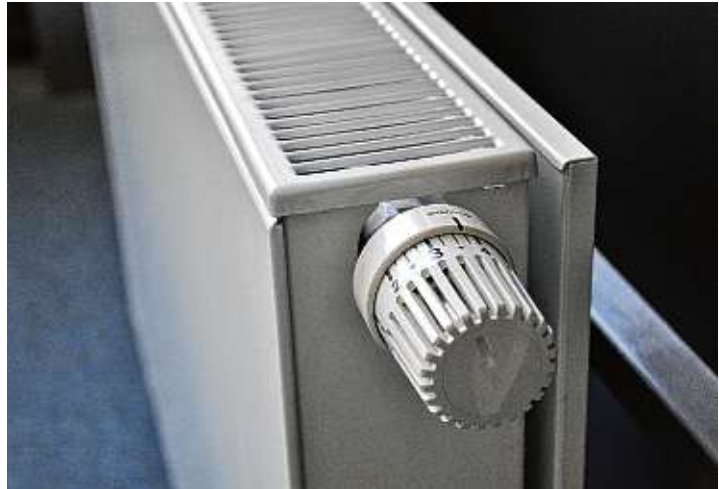
Auf das richtige Heizen kommt es an.

Zu lange sollte allerdings auch nicht gelüftet werden, da sonst wieder die Mauern auskühlen. Eine konstante Raumtemperatur ist auch energetisch günstiger und schont daher auch den Geldbeutel. Denn eine Heizung, die schwer arbeiten und Räume von »eiskalt« auf »mollig warm« hochheizen muss, frisst viel Energie, wohingegen eine einmal erreichte Grundtemperatur leichter gehalten werden kann. Weniger genutzte Räume können dabei ruhig etwas kühler sein, sollten aber auch nicht kühler als 16 bis 17 Grad Celsius werden. Damit effektiv und kostengünstig geheizt werden kann, ist neben intelligentem Heizen und Lüften auch ein einwandfreies Funktionieren der Heizung ein Muss. Regelmäßige Wartung und Reparatur spart auf lange Sicht nicht nur bares Geld, sondern schont auch die Gesundheit und sorgt für ein wohlig warmes Zuhause