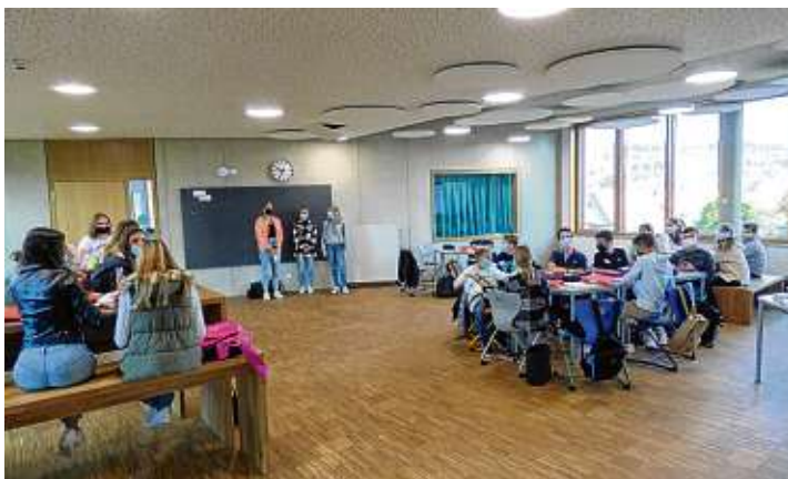
Praktisch und theoretisch lernen die Schüler pädagogische Grundlagen, Konfliktlösung und soziale Kompetenz.

Eichendorff-Realschule startet Schülermentorenprogramm