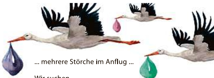
... mehrere Störche im Anflug ...

Verkehrsbeeinträchtigungen in der Gemeinde Gottmadingen Ebringen und Dietlishof: Sperrung der Ortsdurchfahrt K6143 von 10:30 bis 15 Uhr und der K6143 ab der Abzweigung B314 nach Dietlishof. Gemeinde Gottmadingen: Sperrung der L190 zwischen Hilzingen und Gottmadingen auf der Höhe der Zufahrt Riederhof von 10:45 bis 15 Uhr. Die Zufahrt zum »Katzental« ist in der Zeit von circa 10:45 bis 15:15 Uhr nur über Gottmadingen möglich.