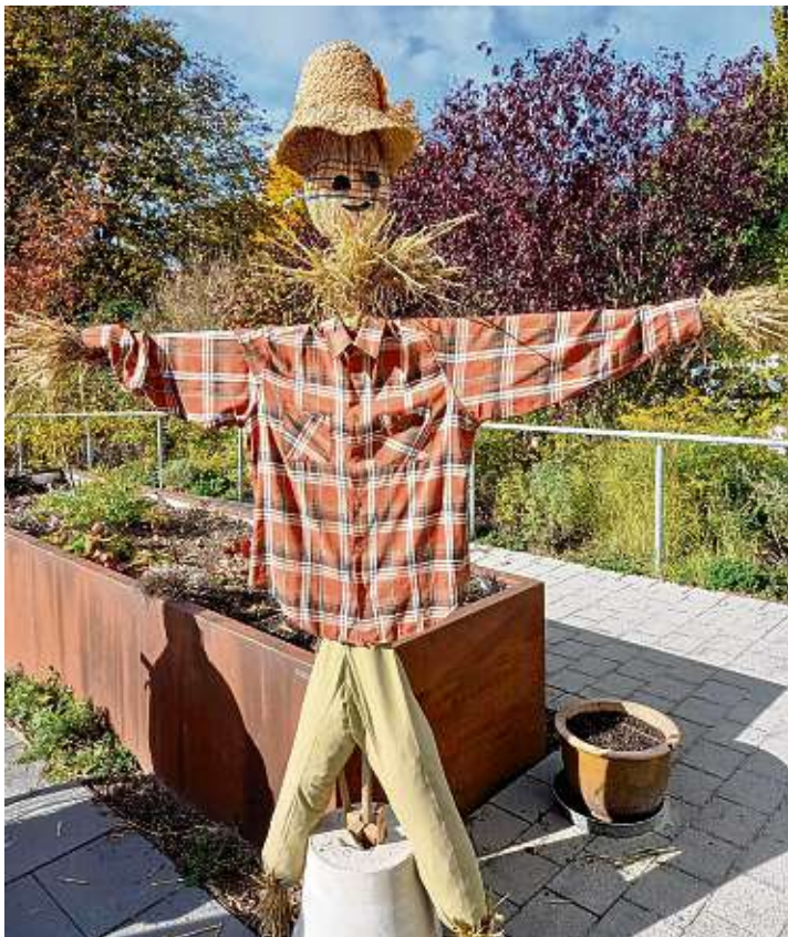
Deutschlands schönste Vogelscheuche steht im Garten der Tagespflege St. Martin in Gottmadingen. Die Gäste und Mitarbeitenden der Tagespflege haben gemeinsam die Vogelscheuche aufgestellt und angezogen. Alle hatten eine riesige Freude dabei und sorgten damit für ein Stück Normalität nach Corona.