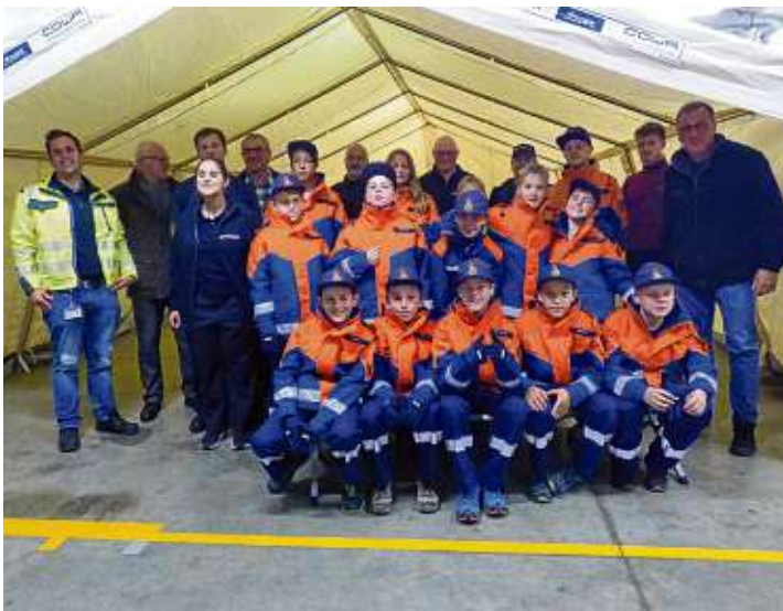
Die Mitglieder der Jugendfeuerwehr freuten sich riesig über das große Zelt, die Sponsoren und die anderen Feuerwehrmitglieder freuten sich mindestens genauso.

Jugendfeuerwehr baute ihr großes Zelt auf