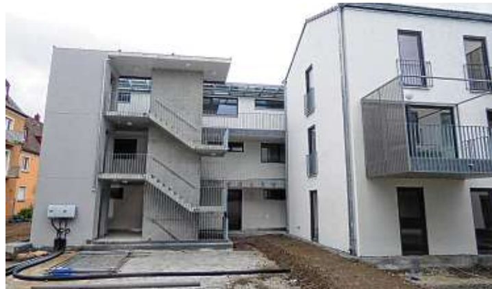
Die Außenanlagen entstehen noch, die ersten Mieter sind schon eingezogen.