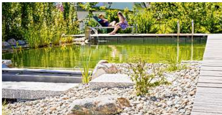
Ein Naturpool aus der Feder von Schwehr Garten- und Landschaftsbau.

»Ob Neuanlage, Umgestaltung oder Pflege Ihrer Außenanlage, wir schaffen mit Ihnen einen schönen und stilvollen Garten«, versprechen Norgard Österle und Ingo Schwehr. »Mit Ansichtsskizzen aus verschiedenen Blickwinkeln des Gartens zeigen wir unseren Kunden be-