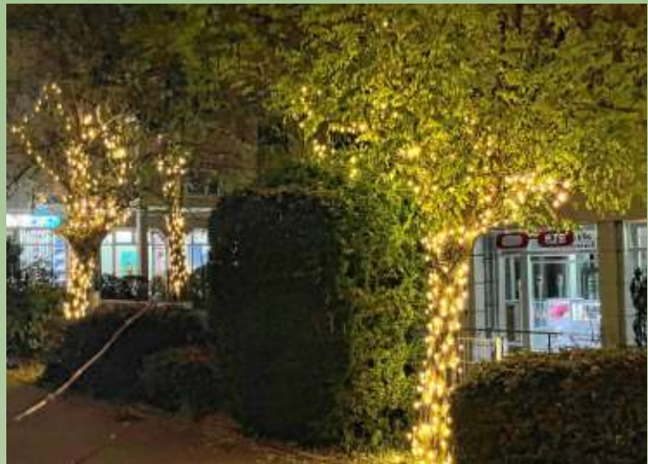
Bei dieser festlichen Beleuchtung bekommt man Lust auf shoppen.

Gerade in der dunkleren Jahreszeit und auch besonders während diesen ernsten Zeiten ist man um jede Abwechslung froh und der festlich geschmückte Ortskern lädt sicher den ein oder anderen ein, seine Weihnachtseinkäufe vor Ort in Gottmadingen anstatt im Internet zu erledigen.