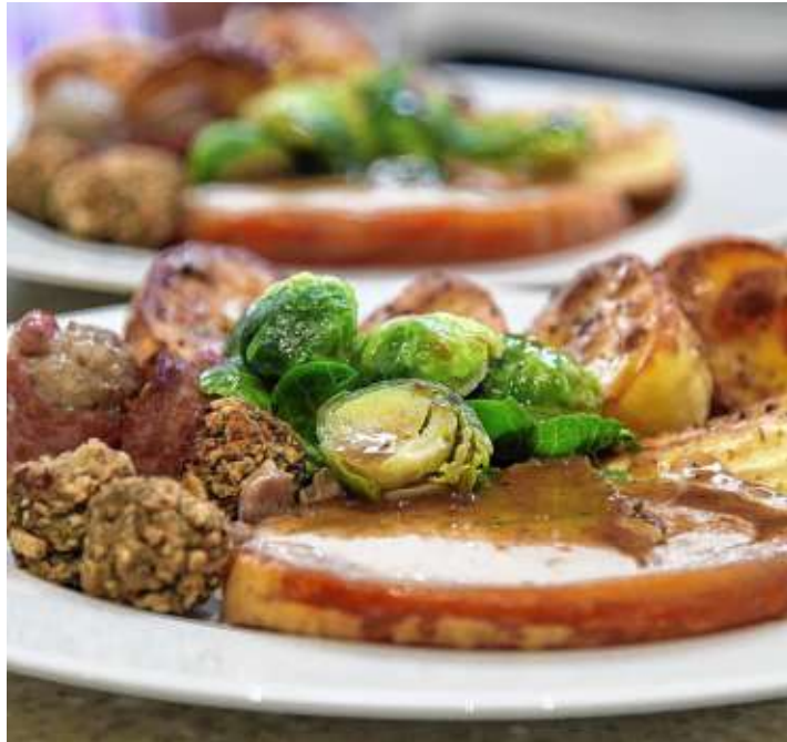
Da läuft einem direkt das Wasser im Mund zusammen.