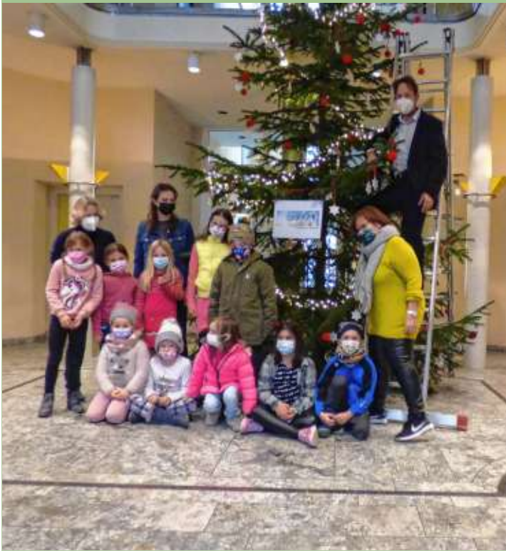
Alle freuten sich über den toll geschmückten Baum.