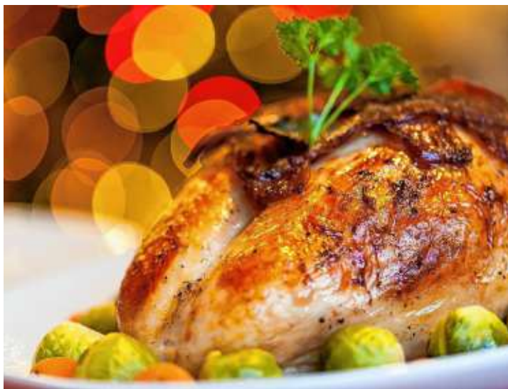
Ein Braten passt an Weihnachten immer. Aber auch weniger schwere Gerichte munden zur besinnlichen Weihnachtszeit.