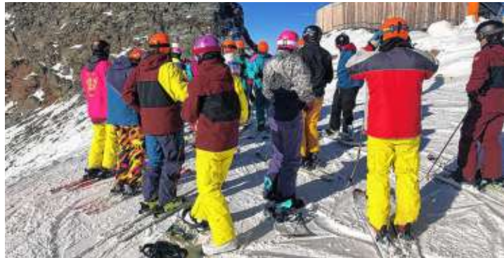
Die Ski-Saison ist für den Ski-Club Gottmadingen angelaufen.

Gottmadingen. Nachdem die Wintersportsaison 2020/2021 coronabedingt für den Ski-Club Gottmadingen komplett abgesagt werden musste, freuten sich alle Übungsleiter und Mitglieder umso mehr auf die Saisonausfahrt vom 12. bis 14. November, sie fand mit 52 Teilnehmer im Gletscherskigebiet Stubaital statt. Bereits zum Anmeldebeginn der Einweisung hat sich der Ski-Club vorsorglich auf ein 2G-Konzept (geimpft oder genesen) festgelegt. Dass sich dies als genau richtig herausgestellt hat, wurde nicht nur durch die steigenden Coronazahlen, sondern auch aufgrund des Lockdowns für Ungeimpfte in Österreich bestätigt.