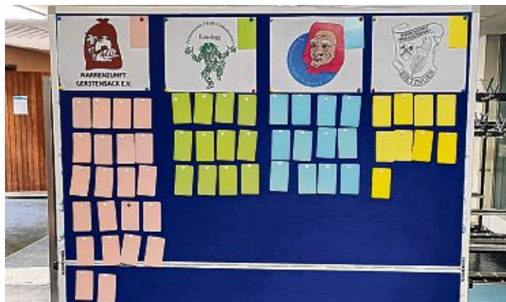
Bis zum Schluss blieb es spannend, insgesamt kamen 55 Narren zum Blutspenden in die Eichendorff-Halle.