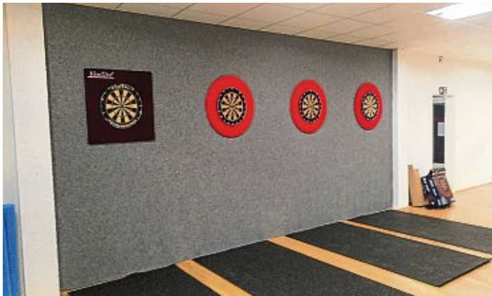
In der neuen TuS-Sportstätte sollen bald wieder die Darts fliegen.

Gottmadingen. Das Warten hat ein Ende, zumindest sieht es so aus, als könnte es langsam in die Planung der neuen »Steel-Darts-Gruppe« gehen. Darum informiert der TuS Gottmadingen, dass es »demnächst« mit den Steel-Darts losgeht. Die Trainingszeiten sind montags von 20 bis 22 Uhr und donnerstags, von 19 bis 21 Uhr. Das eigene »Ally Pally« ist in der neuen TuS-Sportstätte. Zur besseren Planung bitten die Veranstalter, nachfolgende Informationen vorweg per