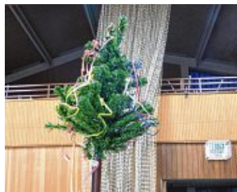
Sogar ein kleines Narrenbäumchen schmückte die Halle.

27. Januar insgesamt 211 Blutspenden getätigt wurden, normalerweise sind es circa 140, auch waren es fast dreimal so viele Erstspender wie sonst. Die Narrenzünfte freute die Aktion ebenfalls und sie freuen sich schon auf eine Wiederholung. Den Gutschein konnte schließlich die Narrenzunft Fidelia Unkenbrenner erringen. Insgesamt 24 Prozent der Unkenbrenner kamen in die Eichendorff-Halle und spendeten Blut (zwölf Spenden). Auf dem zweiten Platz landeten die Bietinger Biberschwänze mit 19,57 Prozent (neun Spenden). Dritter wurden die Gerstensäcke mit 14,86 Prozent (22 Spenden) und die Vierten im Bunde waren die Heilsberghehen mit 9,38 Prozent (zwölf Spenden).