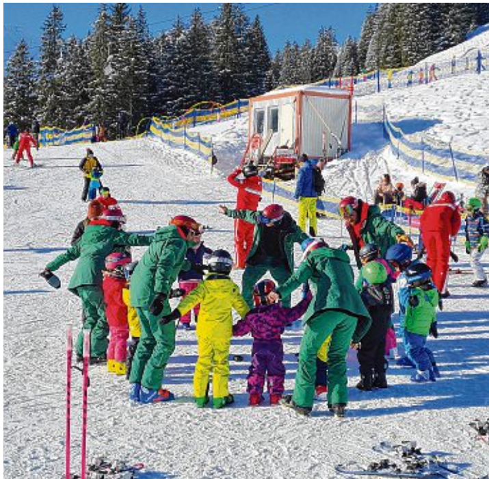
Bei bestem Kaiserwetter hatten die Teilnehmer viel Spaß und lernten viel.

Teilnehmer strahlen mit der Sonne um die Wette