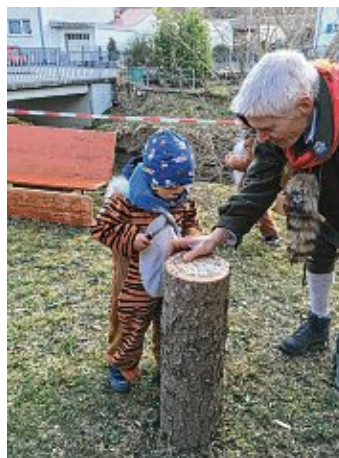
Beim Einschlagen der Nägel in den Baumstamm war Geschicklichkeit und Präzision gefragt.