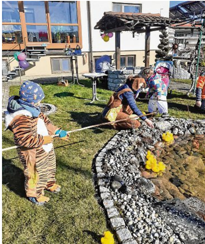
Beim Enten-Angeln konnten die kleinen Narren in Bietingen ihre Geschicklichkeit beweisen.

Am Ende gab es für jedes Kind einen Preis als Belohnung für die tolle Leistung. Die große Begeisterung und Dankbarkeit der vielen teilnehmenden Familie belohnte die Narrenzunft für ihren Aufwand und es freute die Närinnen und Narren in Bietingen, wenigstens ein wenig Faschnachtsstimmung im Dorf verbreiten zu können.