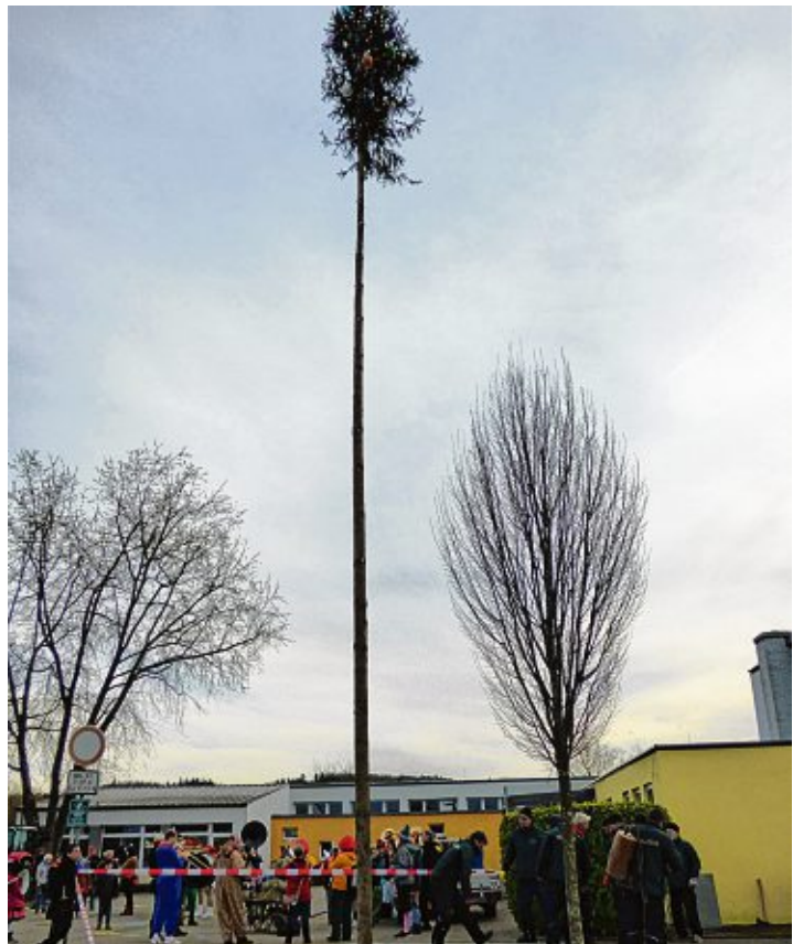
Hoch ragt der Bietinger Baum über der Schule.