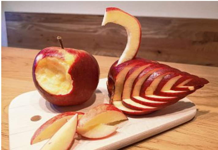
Egal ob essbare Kunst, einfach aufgeschnitten oder direkt in den Apfel gebissen, Äpfel sind immer beliebt.