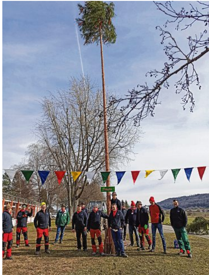
Auch in Randegg stellte die Narrenzunft Fidelia Unkenbrenner zusammen mit der Feuerwehr den Narrenbaum an der Grundschule und läuteten damit die fünfte Jahreszeit ein.