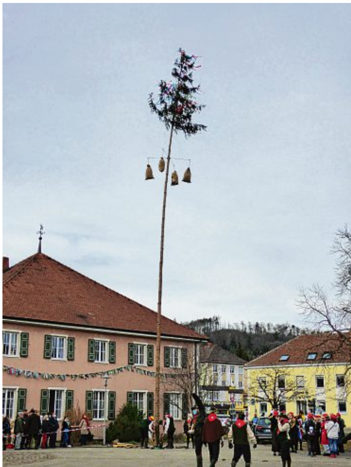
Stolz ragt der Narrenbaum am Alten Rathaus in die Höhe.

Moralische Unterstützung erhielten die Holzer auch von einer Gruppe Musikanten, die sich aus den Originalen Austeigern und dem Musikverein Gottmadingen kurzfristig zusammengetan hat, extra für diesen Zweck. Von der Musik und den Zuschauern angefeuert gelang die Herkules-Aufgabe und der Baum ragte stolz in die Höhe