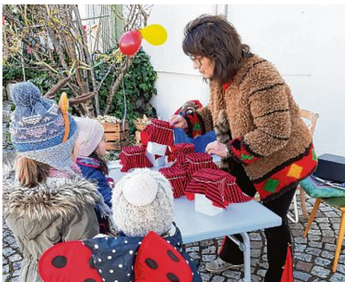
Die Kinder hatten bei den Spielen viel Spaß.