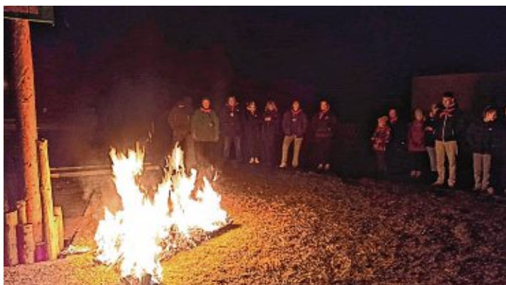
Auch in Randegg verbrannten die Unkenbrenner die Fasnacht.