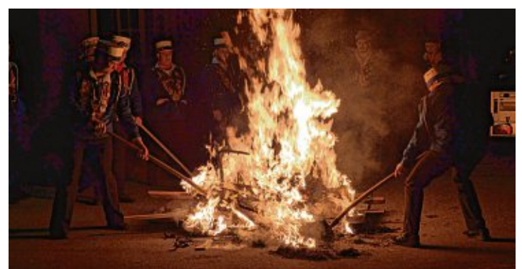
Die Fasnacht in Gottmadingen brannte lichterloh, die Narrenbolizei hatte es aber im Griff.