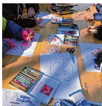
Sogar eigene Bibermasken konnten die Kinder basteln, der Kreativität waren keine Grenzen gesetzt.