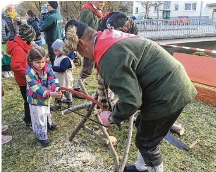
An der Station der Hau-Ruck-Holzer lernten die Kinder alles, was ein künftiger Holzer wissen muss.

Am Sonntag war in Bietingen viel geboten