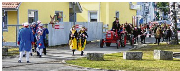
Standesgemäß kam der Narrenbaum auf dem Platz an.