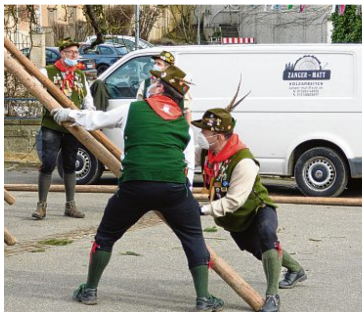
Mit vollem Körpereinsatz wurde der Baum gestellt.