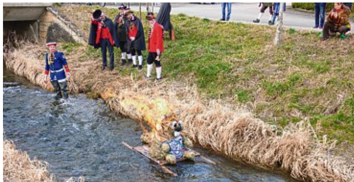
Wehmütig schauen die Narren dem brennenden Biber hinterher.