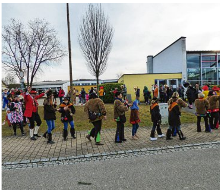
In einem bunten Reigen feierten die Bietinger Narren ihren Baum.