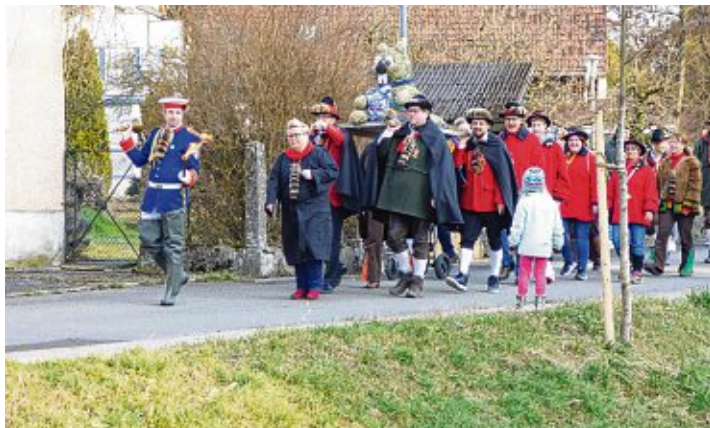
Mit Trauer im Herzen machten sich die Bietinger Biberschwänze auf den Weg, die Fasnacht zu Grabe zu tragen.

dankte auch dem Fanfarenzug für die musikalische Begleitung und übergab an den Fasnachtspfarrer, der in einer herzergreifenden Rede im Schein der Fackel auf die vergangene Fasnacht zurückblickte aber auch versuchte Trost zu spenden. Und so »war's etzt halt andersch't« - in Anlehnung an das diesjährige Fasnachtsmotto »Etzt isch's halt andersch't« - und die Fasnacht wurde von der Narrenbolizei entzündet. Die Strohpuppe fing sogleich Feuer und unter Wehklage trauerte die Narrenschar um die vergangene Fasnacht, leider ohne traditionelles Feuerwerk.