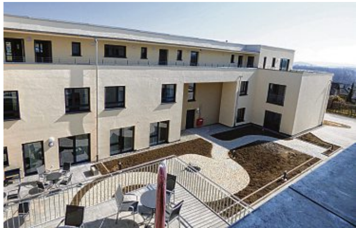
Das Evangelische Pflegeheim »Aachquelle« präsentiert sich offen, hell und modern.

Einig waren sich alle Anwesenden der Eröffnungsfeier im kleinen Rahmen, dass die kleine familiäre Atmosphäre in der »Aachquelle« sehr gut zu Aach passe. Die familiäre Größe decke laut Bürgermeisterstellvertreterin Simone Hornstein den Bedarf der Gemeinde zur Genüge. Die Synergieeffekte durch die Zusammenarbeit mit dem Schwesterhaus in Stockach werden laut