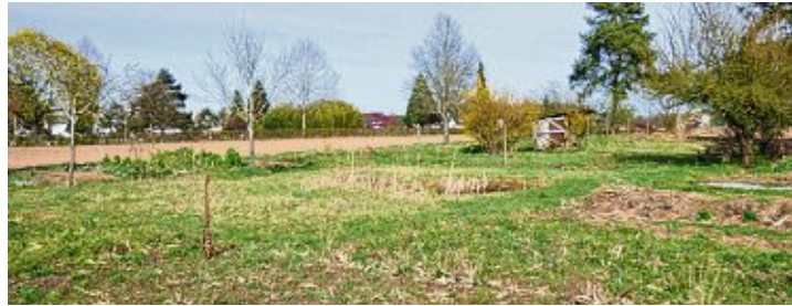
Im BUND-Garten wächst eine Vielzahl gefährdeter Arten.

Pasteurisierungsmaschine, mit der 100 Liter in der Stunde pasteurisiert und haltbar gemacht werden können. »Die Nachfrage während der Apfelernte für die Maschine war so groß, dass wir sogar eine Zweite anschaffen mussten«, freute sich Koch. Nicht nur können selbst mitgebrachte Flaschen für den Apfelsaft genutzt werden, der BUND hat auch sogenannte »Bag in Box«, also ein Beutel mit Zapfhahn in einem Karton, mit denen der eigene Apfelsaft sicher und bequem gelagert werden kann. Wo die Äpfel für den Apfelsaft herkommen können, zeigte Koch als nächstes: die Streuobstwiesen am Heilsberg. Diese waren lange verwildert und vernach-