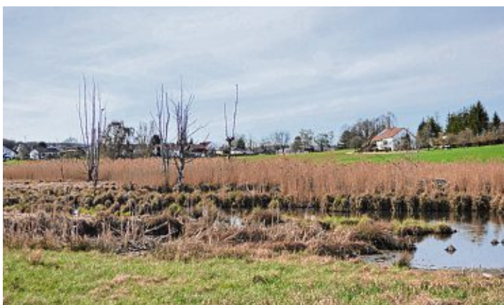
Bei Murbach konnte das Werk des Bibers bestaunt werden.

Als Abschluss der Tour rund um Gottmadingen und seine Ortsteile ging es zum BUND-Garten beim Gottmadinger Friedhof. Dort zeigte Koch den Gästen die besonderen Pflanzen, die hier wachsen und ein Paradies für Insekten darstellen.