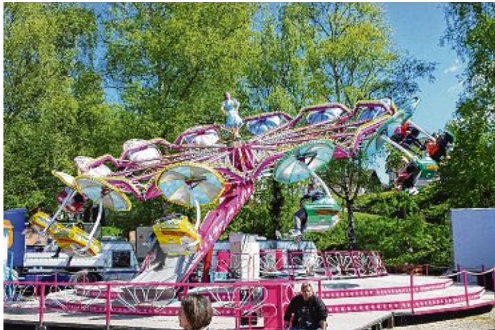
Der Vergnügungspark wird auch dieses Jahr wieder seine Tore öffnen.