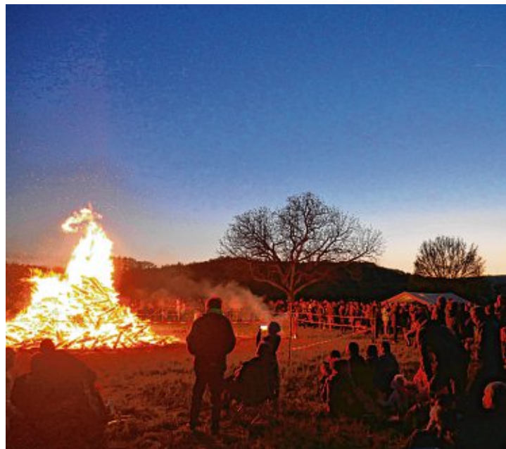
Oberhalb des Bietinger Sportplatzes fanden sich zahlreiche Besucher ein.

Gemütlichkeit bis in die späten Abendstunden