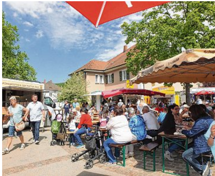
Alle Beteiligten hoffen, dass dieses Jahr wieder viele Besucher kommen werden.

Auch bei der Feuerwehr wird viel geboten: Neben dem Fröhshoppen am Sonntag, der durch den Musikverein Randegg mit flotten Rhythmen begleitet wird, wird es auch an diesem Tag eine Vorführung eines vollelektrischen Löschfahrzeugs geben, das ganze Wochenende über ist das Feuerwehrhaus für Besucher geöffnet.