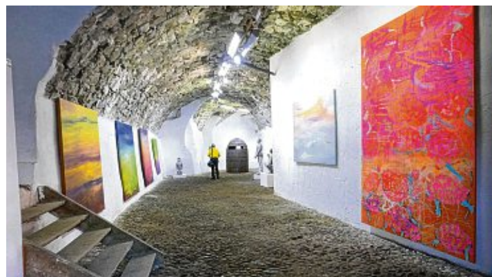
An den nächsten beiden Wochenenden, jeweils Samstag und Sonntag von 13 bis 18 Uhr, hat die »EXPERIMENTELLE 21« noch die Tore in den Räumen rund um den Schlosshof in Randegg geöffnet. An vier Tagen können Kunstinteressierte sich die Ausstellung moderner Gegenwartskunst anschauen, auf sich wirken lassen, bei Wunsch auch kaufen und bei sich zu Hause genießen. Bilder und Skulpturen von 24 KünstlerInnen behaupten sich in den Räumen, die das Gegenteil einer musealen Atmosphäre ausstrahlen und so diese einmalige direkte Annäherung zulassen. Der Förderkreis für Kultur und Heimatgeschichte Gottmadingen freut sich auf einen großen Andrang an diesen letzten Öffnungstagen.

glänzt, da die Bundesliga erst Ende September startet. In der zweiten Woche reist die Erste zum RSV Schuttertal, danach kommen AC Gutach-Bleibach und SV Tribergen. Die zweite Mannschaft der RHL sicherte sich den Klassenerhalt in der Landesliga und wird auch in diesem Jahr in dieser Liga starten. Gleich zu Beginn empfängt sie das Team von Aufsteiger KSV Appenweiler 2. Kampfbeginn ist hier um 18:30 Uhr. Auch für die Zweite gilt, sich im starken Feld der Landesliga zu behaupten, sechs Teams sind Bundes-, Regional- oder Oberligareserven, dazu kommen der TSV Kändern ASV Germania Hornberg sowie der ASV Altenheim. Es wird eine spannende Saison für beide Teams, zumal die gegnerischen Mannschaften aufgrund der vielen Zu- und Abgänge im Vorfeld sehr schwer einzuschätzen sind. Die Runde der Schüler beginnt dann am 17. September nach dem Ende der Schulferien. Die RHL startet mit drei Teams in der Jugend-Bezirksliga, Jugend-Bezirksklasse und Jugend-Aufbauklasse Bodensee. Die Ringer hoffen auf eine Saison ohne große Einschränkungen und Auflagen und freuen sich, endlich wieder auf der Matte kämpfen zu können. Geplant sind dieses Jahr bei der RHL vier Heimkampftage in der Ringerhalle in Taisersdorf und fünf Heimkampftage in der Eichendorffhalle in Gottmadingen.