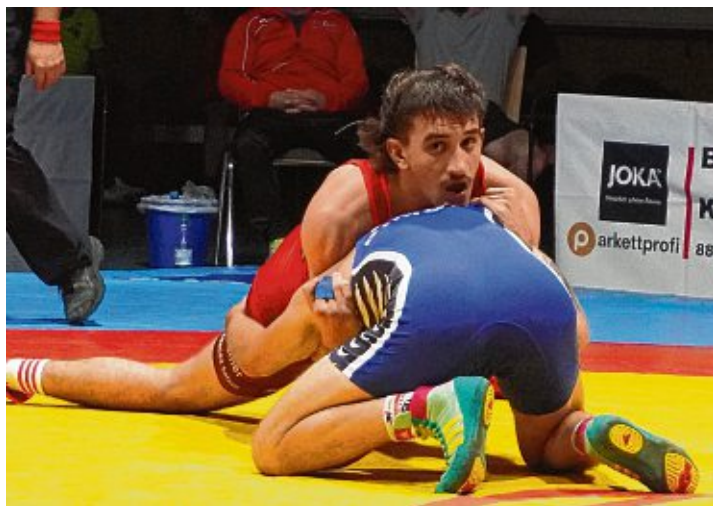
Die RHL Gottmadingen-Taisersdorf hofft auf eine spannende Runde und zahlreiche Gäste beim Saisonstart am 3. September in der Eichendorff-Halle.

RHL Gottmadingen-Taisersdorf startet in die Oberligasaison