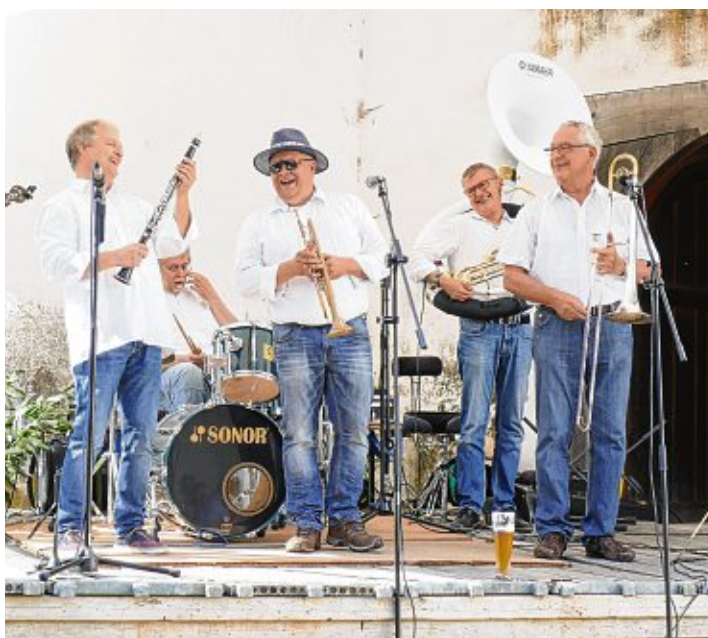
Die »Feierware Jazzband« sorgt am 4. September für gute Stimmung auf Schloss Randegg.

»Feierware Jazzband« auf der Schlossbühne