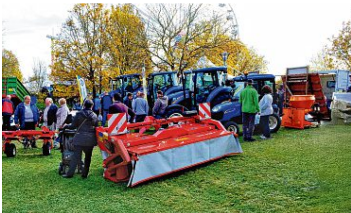
Die Firma Brachat & Schönle stellt beim Schätzele-Markt in Tengen auf dem Rathausplatz Geräte der Firmen Stihl (Gartengeräte), Sabo (Rasenmäher), New Holland (Traktoren) und Kuhn (Anbaugeräte für Traktoren) aus.

Eine Automobilausstellung mit den neuesten Modellen bieten die Autohäuser der Region vor dem Tengener Rathaus.