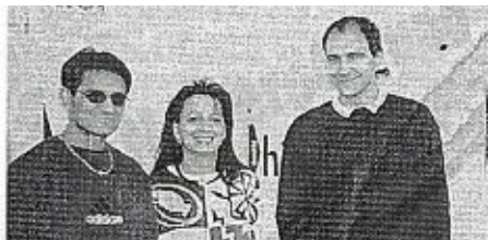
Vor 25 Jahren begann es in Gottmadingen, 2020 kehrte Russo (Mitte) mit einer Filiale nach Gottmadingen zurück.

als 15 Jahre lang war sie bei dem über die Grenzen hinaus bekannten Juwelier Stein in Singen beschäftigt. In dieser Zeit hat sie sich immer mehr von dem Edelmetall Gold und Silber und der Vielfalt von Gestaltungsmöglichkeiten verführen lassen. So hat sie ihre eigene Kreativität