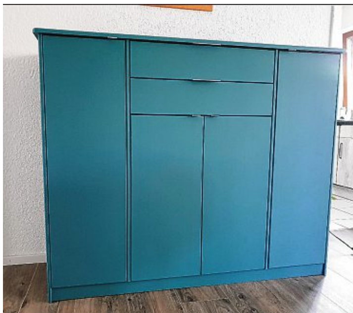
Und so schön ist es nach der Folierung geworden.