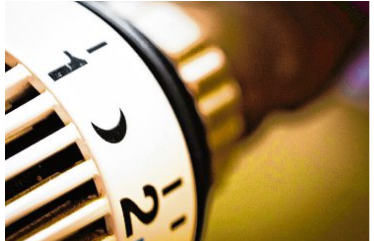
E-Fuels sind im Kommen, allerdings herrscht auf den Märkten Ebbe.

nötigen Modernisierung deutlich mehr investieren. Wenn Öl- oder Gaskessel schon ab circa 12.000 Euro zu haben sind, kosten beispielsweise Pelletkessel fast das Doppelte und benötigen unter anderem sehr viel mehr Lagerraum. Hybridheizungen mit Solarthermie oder Wärmepumpen sind ebenfalls deutlich teurer. Die Gesamtkosten für die Installation einer neuen Heizung sind aufgrund der örtlichen Gegebenheiten von Haus zu Haus verschieden. Das GEG kennt jedoch Ausnahmen: Führt eine gesetzeskonforme Modernisierung zu unbilliger Härte, oder wohnt man selbst seit mindestens 2002 im eigenen Haus, entfällt die Pflicht. Aber auch schon ein einfacher Kesseltausch trägt ab sofort durch die höhere Effizienz und damit geringeren Verbrauch zur CO 2 -Minderung bei. Meist kann das System sogar später noch um erneuerbare Energiequellen erweitert werden. Denn