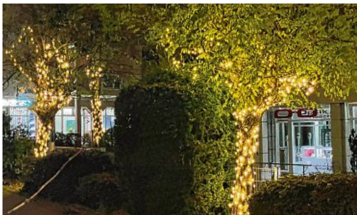
Bei abendlicher Weihnachtsstimmung wird der Zauber des Advents am Donnerstag, 1. Dezember, sicher zu spüren sein.

Der Adventszauber in Gottmadingen versteht sich als ein gemütlicher Treffpunkt, an dem man in geselliger Runde gemeinsam diese besondere Zeit im Jahr genießen kann, sich mit Freunden, Bekannten und der Familie zu einem späten Bummeln über den Abendmarkt trifft und den einen oder anderen Glühwein in Kombination mit kulinarischen Gaumenfreuden genießt.