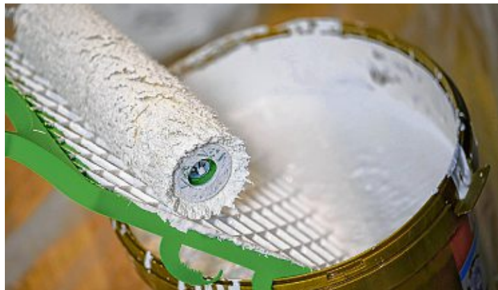
Es muss nicht immer Weiß sein. Der Malermeister berät individuell.

Ob nun elegant oder verspielt, klassisch oder südlich beschwingt – alle Wohnstile setzen auf die Liebe zum Detail, auf individuelle Ausführung und hohe Qualität. Auf dem Weg zu unverwechselbaren, individuell gestalteten Räumen ist also