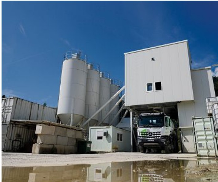
Die neue Transportbeton-Anlage des Betonwerks Kohler

Neuartige Recycling-Betonanlage schont Ressourcen