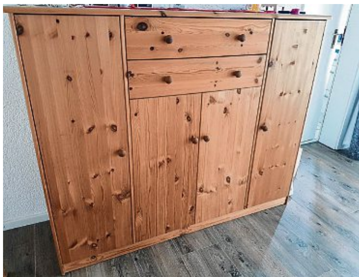
So sah das Schränkchen vorher aus.

Maßstäben fast keine Grenzen gesetzt: Fensterbänke, Küchenfronten, Empfangstheken, Türen, einzelne Möbel und selbst Böden und Wände kommen dabei in Betracht. Der Resimdo-Montagepartner Marco Parente Folien-Verlegung, der schon seit mehr als einem Jahr diese Technik anbietet, steht hierbei für eine kostenlose und unverbindliche Beratung gerne zur Verfügung.