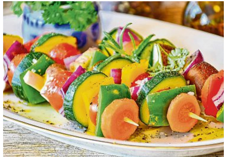
Der Kreativität ist keine Grenze gesetzt, das gilt auch für Gemüse.

Mit Kräuterbutter gefüllte Champignons oder gefüllte Auberginen gelingen am Besten, wenn sie mit Alufolie eingewickelt oder in einer Grillschale gegart werden. Sie sind eine leckere Beilage zu deftigeren Hauptgerichten, die ebenfalls nicht zwingend tierisch sein müssen. Genauso lecker sind Tofu-Schnitzel oder Grillkäse