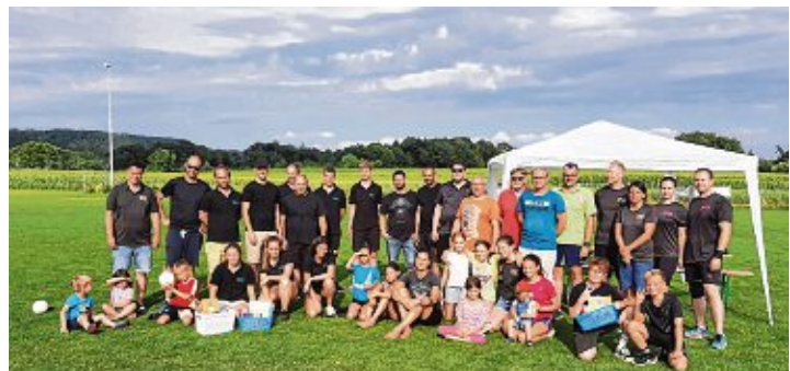
Abschlussfoto der Völkerballspieler.