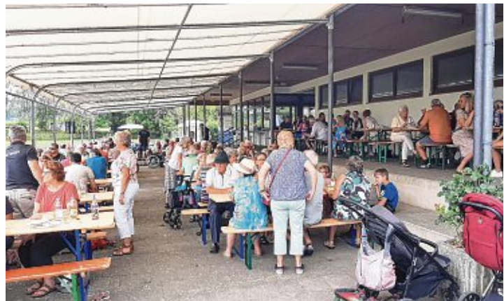
Den gemütlichen Hock zur Mittagszeit ließ sich niemand entgehen.