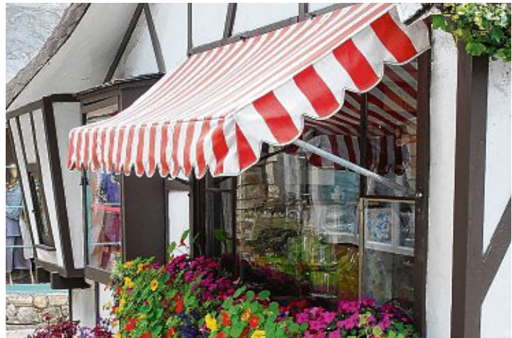
Bei den hohen Temperaturen sind Markisen ein wahrer Segen.

Getränke, so verlockend es auch sein mag, sollten nicht zu kalt sein. Lauwarmer Tee, am besten ungesüßt, ist dabei am effektivsten. Was ebenfalls gegen die große Hitze hilft, sind luftige Kleider. In den eigenen vier Wänden oder dem heimischen Garten ist dem Ablegen