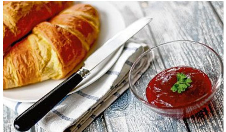
Was auf den Frühstückstisch kommt, ist Geschmackssache - Hauptsache lecker.

ma, desto gehaltvoller wird das Frühstück. Das schwedische Frühstück beispielsweise besteht oft aus »Havregrynsgröt«, einem Brei aus Haferflocken, in gesalzenem Wasser aufgekocht und mit Milch abgelöscht. Dazu kommen Fruchtkonfitüre oder frisches Obst. Knäckebrot wird oft dick belegt mit Wurst, Fisch, gekochtem Ei oder Gemüse. Dazu gibt es »Filmjöl«, eine säuerliche, joghurtähnliche Milch, die entweder pur gelöffelt oder mit Müsli kombiniert wird. In Italien hingegen fällt das Frühstück eher sparsam aus. Typischerweise gehen hier ein Espresso und ein Cornetto, ein Croissant, Hand in Hand. In Polen wird es wieder deftiger: Ein heißer Milchbrei, Haferbrei oder eine Milchsuppe mit Nudeln oder anderen Einlagen, Butterbrote mit Wurst oder Schichtkäse und Konfitüre. Rührei oder gekochtes Ei mit ein paar Scheiben Brot.