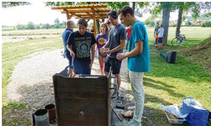
Der Platz am Dirt-Track war Favorit bei der Standortsuche.