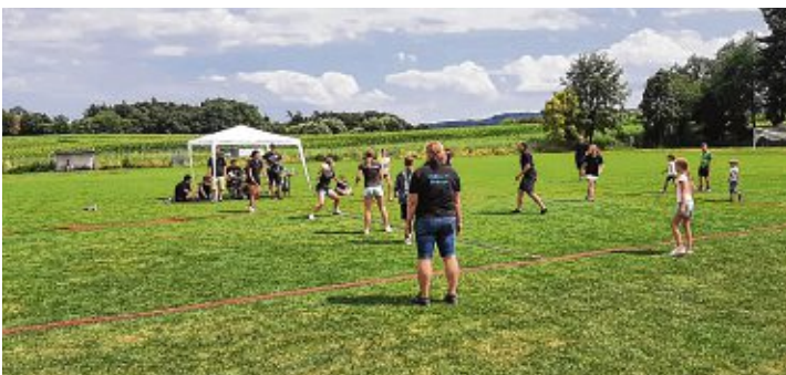
Die Völkerballspieler in Aktion hatten sehr viel Spaß.