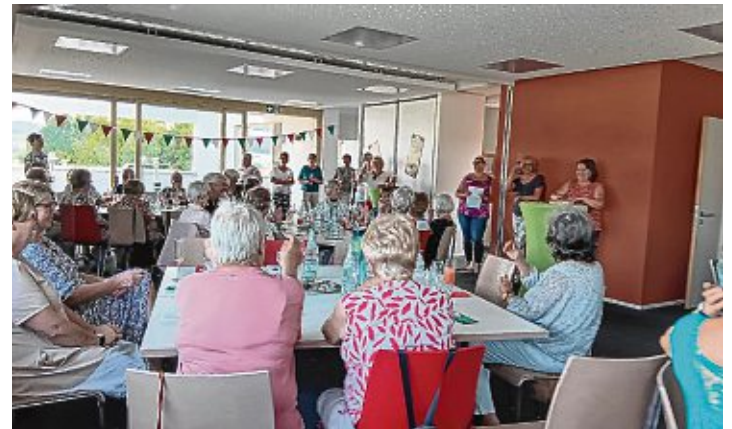
Die kfd hatte sichtlich Spaß auf ihrer kulinarischen Reise.