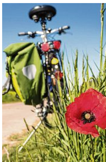
Schönes Wetter macht mehr Spaß, aber auf Schlechtes muss man sich vorbereiten.

E-Bikes Fahrräder Fitness-Geräte Kinderfahrzeuge Reparaturen Zeppelinstraße 1 · 78244 Gottmadingen · Telefon 07731 / 62227 · www.fahrradgraf.de