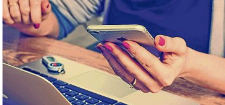
Homeoffice soll auch in der dualen Ausbildung möglich sein.

Empfehlung verabschiedet, die die duale Berufsausbildung in Präsenz durch planmäßiges »Mobiles Ausbilden und Lernen« ergänzt. In der Empfehlung betont der BIBB-Hauptausschuss, dass die duale Berufsausbildung auch weiterhin unter Beachtung aller rechtlichen Regelungen grundsätzlich in Präsenz stattfinden solle. Eine Pflicht des Betriebes, mobile Ausbildung anzubieten, und einen Anspruch der Auszubildenden auf mobile Ausbildung gebe es jedoch nicht. Entscheidet sich ein Betrieb, in der Ausbildung mobiles Ausbilden und Lernen anzubieten, so weist der BIBB-Hauptausschuss unter anderem darauf hin, dass neben der Eignung der Auszubildenden für diese Ausbildungsform die erforderlichen Lehrmittel und die Kompeten-