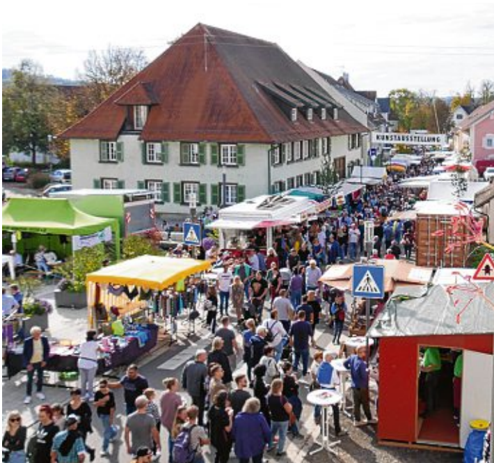
Der Kirchweih-Markt lockt jedes Jahr viele Besucher an.