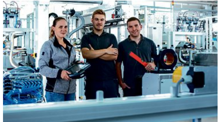
Teamwork und ein spannender Arbeitsplatz – wer das sucht, wird bei der HAHN Automation Group fündig.

Durch die große Vielfalt an Abteilungen, die von der Konstruktion über die SPS-Programmierung, die Montage und die Inbetriebnahme von Anlagen über das Projektmanagement bis hin zu Vertrieb und Service reichen, bietet der Sondermaschinenbauer ein breites Spektrum an Arbeitsplätzen. Die Ausbildung und Förderung junger Menschen sind von zentraler