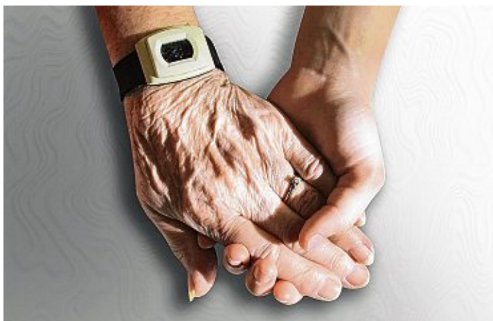
Die Einsatzmöglichkeiten beim FSJ sind vielfältig, sei es in der Altenpflege oder der Verwaltung.

Mehr Informationen gibt es beim Bundesministerium für Familie, Senioren, Frauen und Jugend.