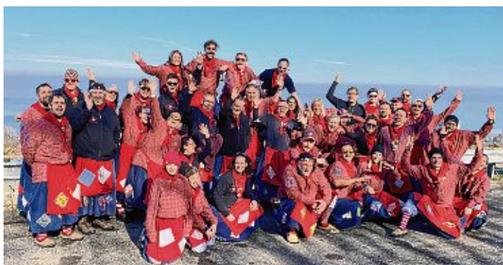
Die Heilsberghexen auf der Fahrt zum Umzug nach Feldkirch in Vorarlberg.