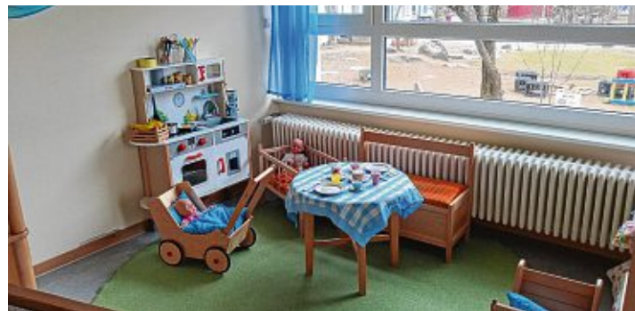
Eine der Spenden ging an den Evangelischen Kindergarten.