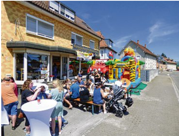
Die Brotmanufaktur Stemke ist an den Aktionstagen Treff für Groß und Klein.