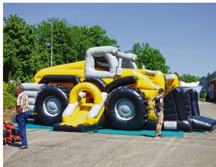
Die riesige Hüpfburg bei »Brachat & Schönle« ist immer ein Anziehungspunkt für die Kleinen, während die Großen das Angebot genießen.