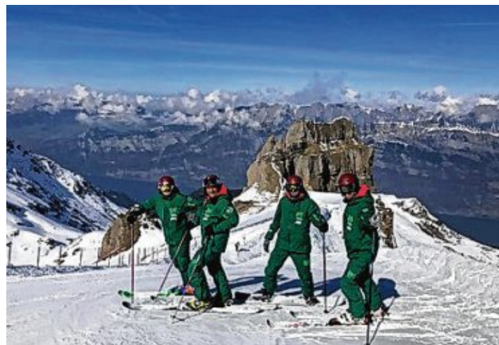
Die Teilnehmer hatten sichtlich Spaß.