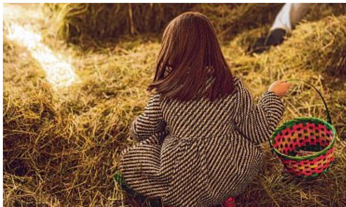
Die Ostereiersuche ist eine lustige Tradition und eine schöne Kindheitserinnerung.