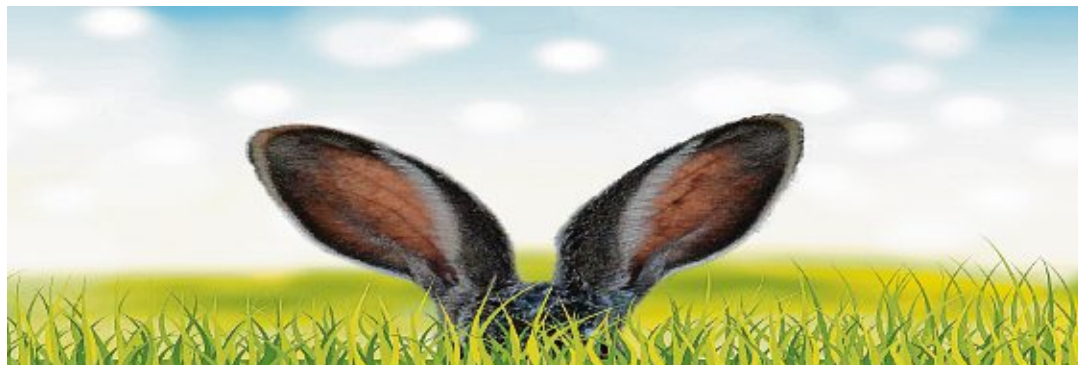
Der Osterhase bringt allerlei Leckereien an Ostern, genau richtig zum Ende der Fastenzeit.