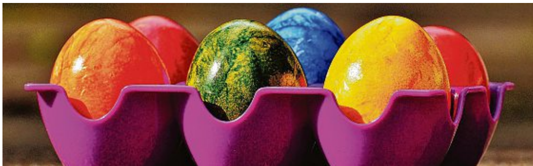
Lecker und hübsch sind die Ostereier, man möchte sie am liebsten das ganze Jahr essen.

Gottmadingen (md). Die Verbindung von Hasen, einem Säugtier, und den Eiern eines Huhns, die auch noch bunt angemalt werden, scheint auf den ersten Blick doch sehr abstrus. Wenn man aber bedenkt, dass in der Fastenzeit Eier verboten waren, die fleißigen Hennen aber trotzdem ihre Pflicht erfüllten, wurden diese haltbar gemacht und bemalt. Auch symbolisieren sie das Leben, das sie in ihrer Schale tragen, ebenso wie das Grab Christi. Und der Hase ist schon von Alters her ein Symbol für Fruchtbarkeit. Erstmals wissenschaftlich erwähnt wird der österliche Meister Lampe bereits 1682 in einer Dissertation.