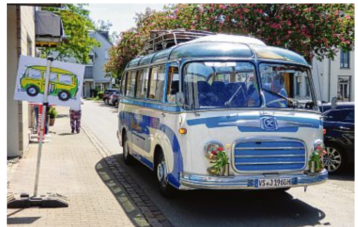
Der beliebte Oldtimer-Bus wird wieder unterwegs sein und die Gäste von A nach B bringen.