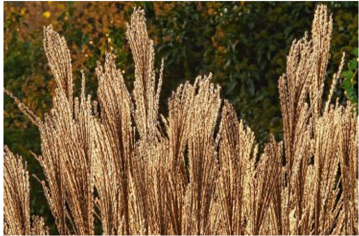
Für besseres Wachstum sollte das Chinaschilf jetzt geschnitten werden.

Aber es wird höchste Zeit, denn wenn das frische Grün erst aus den Horsten sprießt, lässt sich der Schnitt nicht mehr ganz einfach bewerkstelligen, ohne das frische Wachstum zu beschädigen. Übrigens: wer ein Erdbeerbeet sein eigen nennt und dort Schneckenfraß verhindern will, sammelt das Miscanthusgrün, schneidet es klein oder häcksel es und mulcht die Erdbeeren damit. Das scharfe Gras soll für eine entspannte Erdbeerernte sorgen. Wintergrüne Gräser brauchen keinen Schnitt,