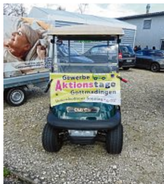
Neben dem bekannten Oldtimer-Shuttlebus beförderten auch Golfcaddys die Besucher der Aktionstage.