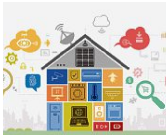
In modernen Haushalten sind technische Helferlein allgegenwärtig.

liegt auf der Hand: Sie erleichtern den Alltag und vor allem die Hausarbeit in vielen Bereichen stark. Doch dieser Komfort hat auch seinen Preis. Jedes Geräte benötigt Strom oder Akkus, Herstellung und Entsorgung der Geräte sind ein Stresstest für die Umwelt. aber ganz egal, ob man sich auf das Notwendige beschränkt oder als Technik-Freak einfach Spaß hat an innovativen Geräten: Die Beratung durch gut geschulte Profis hilft in jedem Fall, nachhaltige Kaufentscheidungen zu treffen. Das schont den Geldbeutel und die Umwelt.