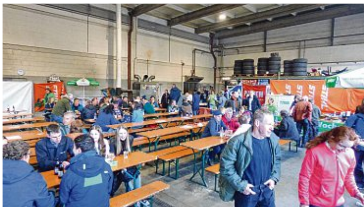
Egal ob Regen oder Sonnenschein, bei »Brachat & Schönle« ließ es sich aushalten.