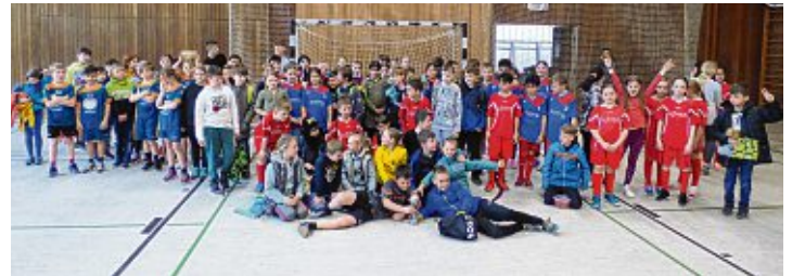
Die Freude der vierten Klasse aus Bietingen war riesig, Spaß hatten alle Kinder beim Förderverein-Cup.