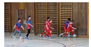
Jeder Ball war hart umkämpft.