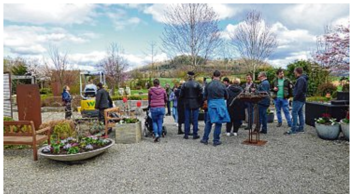
Der Garten von »freiraum« lud zum geselligen Beisammensein ein.