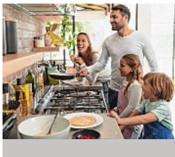
Eine Küche ist mehr als der Raum, in dem gekocht wird – sie vermittelt Zusammengehörigkeit.

Hier gehen Kochen und Kommunikation Hand in Hand