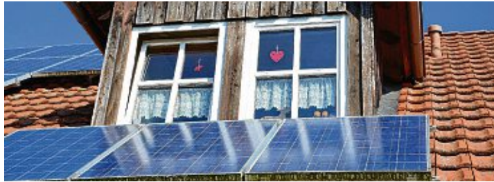
Auch auf der kleinsten Hütte: Mit Solarenergie eigenen Strom erzeugen.