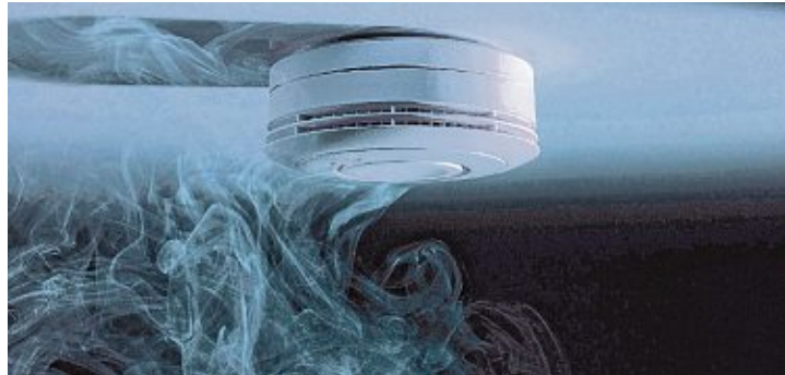
Rauchmelder erkennen Brände frühzeitig und warnen durch ein lautstarkes, akustisches Signal. Wenn sie funkvernetzt sind, lösen sie den Alarm bei allen anderen Geräten in Haus oder Wohnung aus.

Eine Lösung sind funkvernetzte Rauchmelder. Sie funktionieren nach dem Prinzip ‚Einer für alle, alle für einen! Löst ein Gerät Alarm aus, aktiviert es zugleich alle anderen. So gewinnt man wertvolle Zeit, sich und andere Personen zu retten.