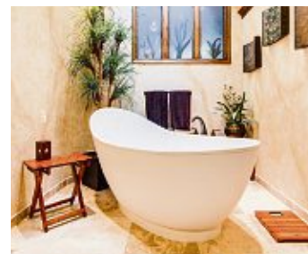
Schick und gleichzeitig funktional soll ein neues Bad sein.

Hegau. Früher oder später müssen Eigenheimbesitzer ihr Badezimmer renovieren. Alte Sanitär-Installation weisen im Laufe ihrer Zeit Defekte auf, das Bad wird neuen Ansprüchen (Stichwort Barrierefreiheit) nicht mehr gerecht oder das Bad soll sich in eine hauseigene Oase entwickeln, wo man wertvolle Stunden der Erholung verbringt. Für eine komplette Sanierung werden viele Gewerke benötigt, darunter: Fliesenleger, Elektriker, Sanitärinstallateure oder Trocken- und Heizungsbauer. Um hier den Überblick zu behalten, lohnt es sich, einen Sanitärfachmann mit der Renovierung zu beauftragen. Er kümmert sich um die Organisation der Handwerker, den Kauf der Materialien und alle weiteren Aufgaben. Handwerklich begabte Menschen können durch Eigenleistungen Geld sparen, aber auch die Zusammenarbeit mit guten Profis kann sich rechnen: Sie kennen Produkte und Preise,