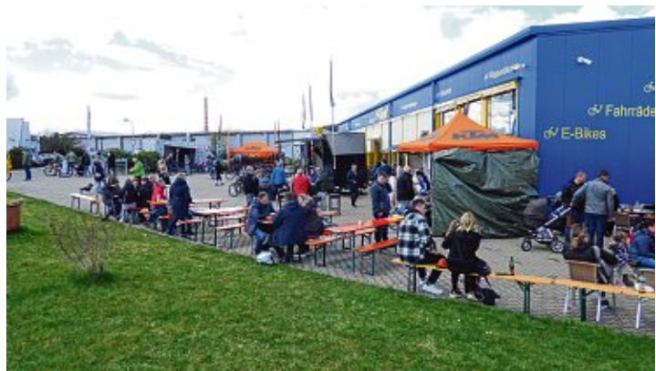
Bei »Fahrrad Graf« war Einiges geboten: Hüpfburg, große Fahrradausstellung und Speisen lockten viele an.