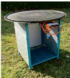
Mongolengrills, Schwenkgrills und Feuerschalen.