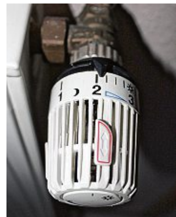
Mit dem richtigen Brennstoff klappt es auch mit dem Sparen – Energie und Geld.

unter www.zukunftsheizen.de www.veh-ev.de oder auf dem futurefuels.blog zu finden.