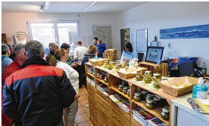
Das Interesse an den Leckereien bei »Delikat essen« war groß.