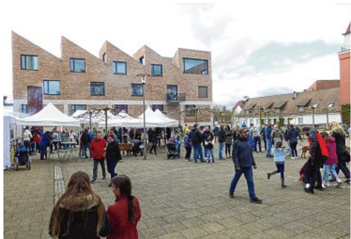
Der Platz vor dem Sudtturm war einer der großen Treffpunkte an den Aktionstagen.

und Gottmadingern sowie Besuchern von außerhalb war. Besonders am Sudtturm gab es viel zu sehen und zu essen. Tanz-Workshops, Mode-, Schmuck- und Dessousshows rundeten das Angebot dort ab. Im Industriegebiet zeigten die ansässigen Betriebe ihr Können und ihre Waren, es wurde gestaunt, ausprobiert, selbst Hand angelegt und allerlei leckere Dinge genossen, sei es bei »Delikat essen« oder bei guter Musik bei »Brachat & Schönle«, wo der KSV Gottmadingen auftrifft, inklusive guter Musik.