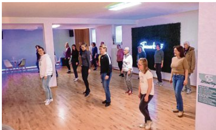
Die Tanz-Workshops von »Tanzwerk 95« machten sichtlich Spaß.