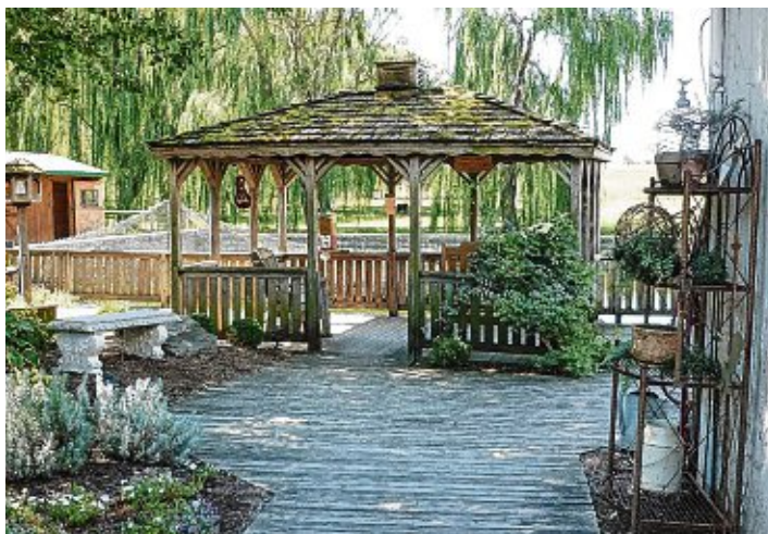
Eine Holzterrasse ist einladend, mit der richtigen Behandlung hält sie lange.

Das Institut für Holzbiologie und Holzprodukte der Universität Göttingen hat die Widerstandskraft der Massivholzdiele in Prüfungen bestätigt, die Klasse 1 ist