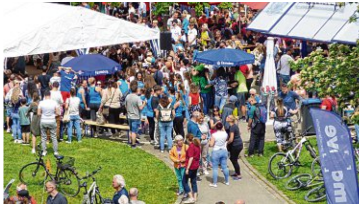
Fast 25.000 Menschen waren am Sonntag, 21. Mai, am »slowUp« unterwegs, sicherlich viele davon sind auch durch Gottmadingen gekommen und haben den Tag, der ein Fest der Vereine in Gottmadingen ist, zu einem ganz besonderen gemacht. Mehr zum »slowUp« in Gottmadingen auf Seite 3.