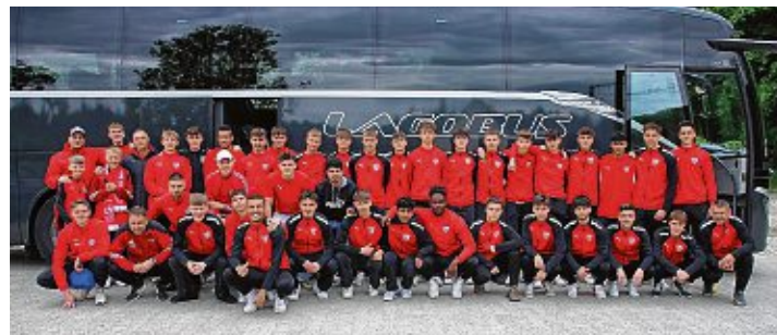
Die gemeinsame Anreise per Bus war ein Highlight für das unglaubliche Erfolgswochenende.

Durch die Verlängerung mussten auch die A-Junioren auf den Anpfiff warten. Aber sie waren schnell auf Betriebstemperatur. Alle Spieler waren an Bord und wollten gewinnen. Keiner hatte eine leichte Erkältung, kein Muskelzucken und Muttertags-Kaffee gab es ja schon am letzten Spieltag. Mehyar Albarjas versteckte seine Nase hinter einer