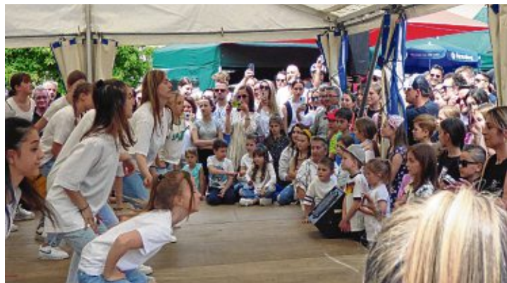
Der Andrang bei den Auftritten des »Tanzwerk 95« war riesig.