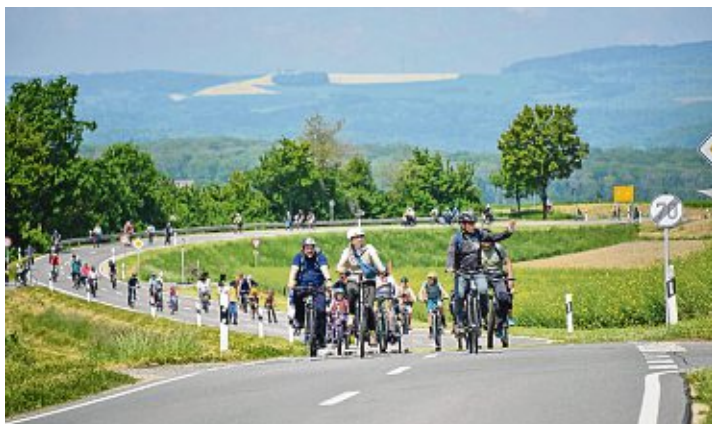
... als auch im Hegau waren die Radfahrer unterwegs.

Die 18. Austragung wird voraussichtlich am Sonntag, 26. Mai 2024, durchgeführt. Im laufenden Jahr finden noch zwölf weitere slowUp in der Schweiz statt. Migros und Swica fungieren als nationale Hauptsponsoren. Gesundheitsförderung Schweiz, SchweizMobil und Schweiz Tourismus bilden die nationale Trägerschaft. Weitere Informationen sind unter www.slowUp.ch abrufbar.