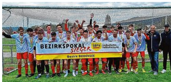
Die B-Junioren zeigten Nerven und belohnten sich am Ende mit einem Sieg.