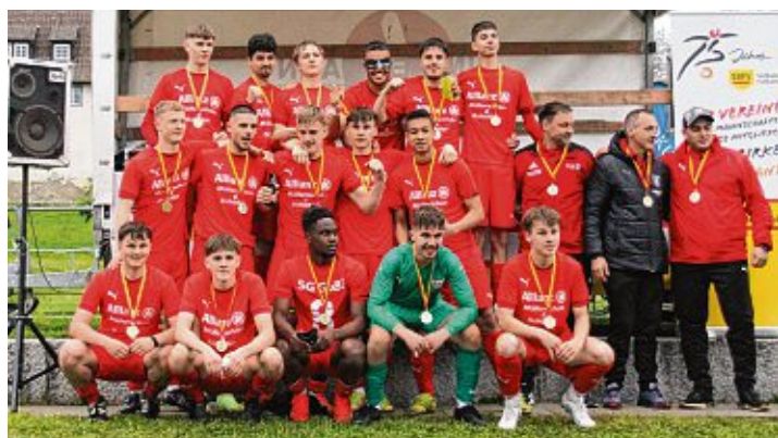
Drei Tore in elf Minuten waren nur der Anfang für die A-Junioren.