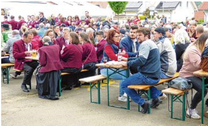
Rappelvoll – anders konnte man den Schulhof am Vatertagsfest in Bietingen nicht beschreiben.

Vatertagsfest in Bietingen ein voller Erfolg