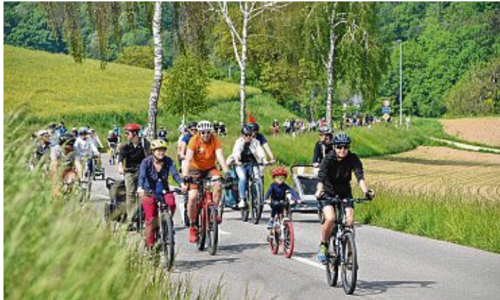
Sowohl in der Schweiz...

17. »slowUp Schaffhausen-Hegau« lockte fast 25.000 Freizeitsportler auf den Rundkurs