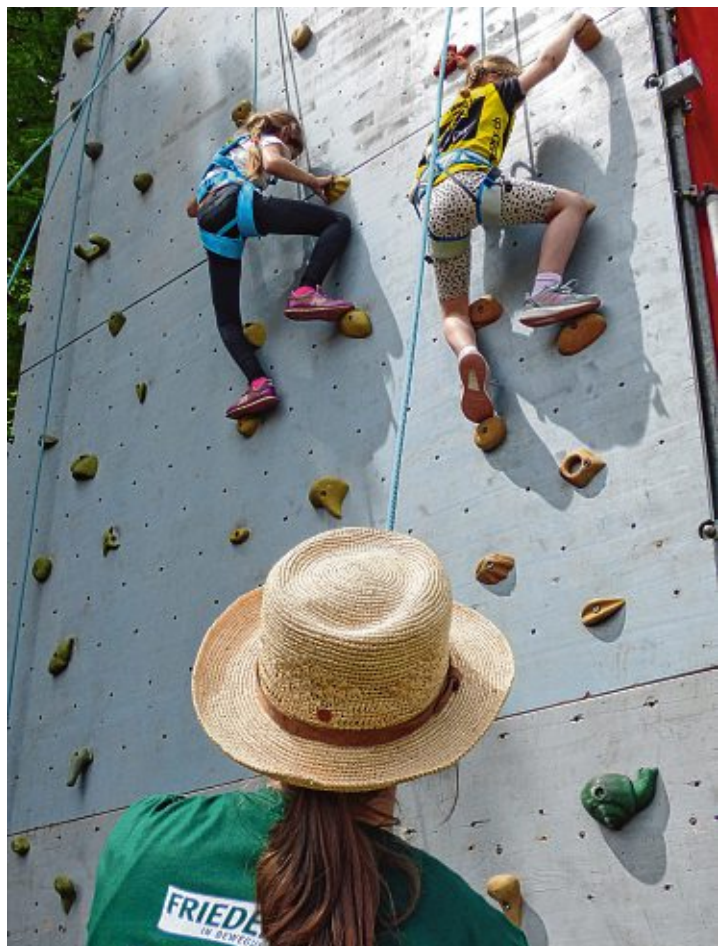
An der Kletterwand trauten sich die Kinder, gesichert durch die Naturfreunde, in luftige Höhen.