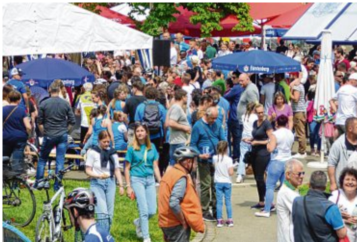
Bei dem vielfältigen Angebot war es kein Wunder, dass der Gottmadinger Festplatz so voll war.