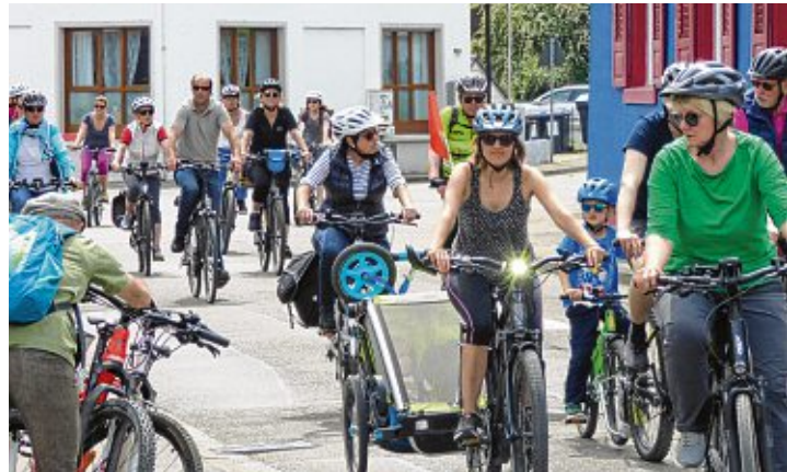
Über die Kirchstraße gelangten die unzähligen Radfahrer zum Festplatz in Gottmadingen.

Bevor es dann frisch gestärkt und mit bester Laune aus Gottmadingen weiter ging, konnte man noch den einen oder anderen Schaden am Fahrrad vom kostenlosen »RadCHECK« begutachten und reparieren lassen.