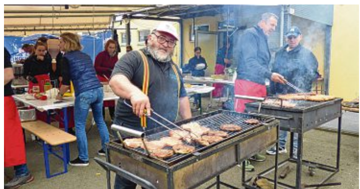
So schnell wie die Schnitzel auf dem Grill landeten, so schnell waren sie auch schon wieder verkauft.

Nicht nur Rehe sind zur Zeit in »Kinderschuh«. Auch Füchse, Hasen und Bodenbrüter haben Nachwuchs. Auch diese danken für Rücksicht.