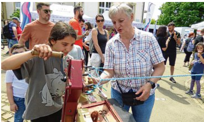
Das Seiledrehen auf dem Schulhof war ein wahrer Publikumsmagnet.