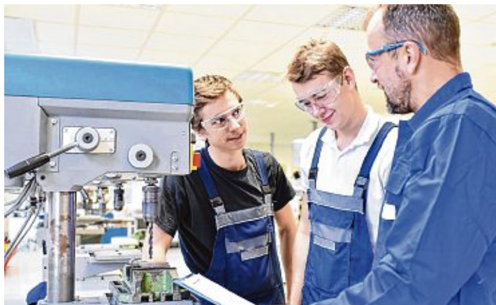
Die Qualifikationsanforderungen bei den Ausbildungsberufen steigen - engagierte Ausbilder können die Jugendlichen hier motivieren.

Hegau. SchulabgängerInnen mit Hauptschulabschluss haben es dagegen immer schwerer, einen Ausbildungsplatz zu bekommen. Zwischen 2011