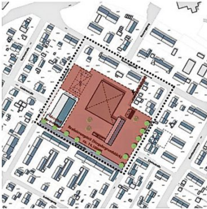
Abb. 02: Lageplan | Rahmenbedingungen

Pläne für das Areal der ehemaligen Eichendorffschule werden öffentlich ausgestellt