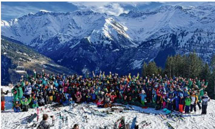
Alle Teilnehmer und Übungsleiter hatten viel Spaß.