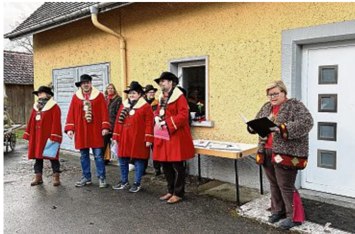
Gemeinsam mit dem Schultes und den Gemeinderäten wurde das »Gmonds-hüsle« befreit.