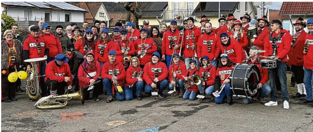
Mit dem Musikverein Bietingen zogen die Narren durch das Dorf.