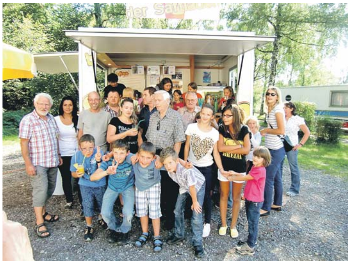
Mit einem großen Abschlussfest endet das Sommerferienprogramm am Freitag, 6. September, von 15 bis 18 Uhr rund um den Jugendtreff an der Fahrkantine.