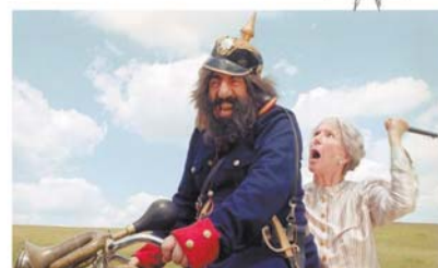
Herrlich albern und irre lebenswürdig Deutschland 2006 Länge: 94 Min. Empfehlung: ab 6 J. FSK: o. A.

„Ich raube mir, was mir gefällt, dafür bin ich bekannt“, prahlt der Räuber Hotzenplotz - laut eigener Aussage der bedeutendste Räuber weit und breit. Und hätte er nicht ausgerechnet die geliebte Kaffeemühle der Großmutter geklaut, dann ... ja dann hätten sich der Kasperl und der Seppel nicht auf die gefahrvolle Suche gemacht und dabei ihre Mützen nicht getauscht. Dann wären vielleicht auch nicht der Wachtmeister Dimpfelmoser und die Wahrsagerin Frau Schlotterbeck samt ihrem, in ein Krokodil verwandelten, Dackel Wasti zusammen gekommen. Und die schöne Fee Amaryliss hätte für immer und ewig als eklige Unke in den Verliesen des bösen Zauberers Zwackelmann schmachten müssen. Aber am Schluss bekommt jeder das, was er verdient: