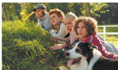
Spannend und unterhaltsame 2. Verfilmung der gleichnamigen Buchserie Deutschland 2013 Länge: 92 Min. Empfehlung: ab 9 J. FSK: o. A.