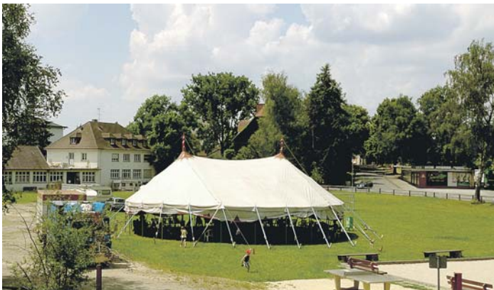
Der Zirkusworkshop in den Pfingstferien findet in einem Zirkuszelt auf dem Festplatz bei der Fahr-Kantine statt.

Anmeldeformulare sowie alle weiteren benötigten Vordrucke für den Zirkusworkshop gibt es auf der Homepage der Gemeinde Gottmadingen unter www.gottmadingen.de - Leben in Gottmadingen - Ferienbetreuung und im Büro der Jugendpflege bei Steffen Raible im Rathaus, Johann-Georg-Fahr-Straße 10, Zimmer 001. Dort können die ausgefüllten Anmeldeformulare auch abgegeben werden.