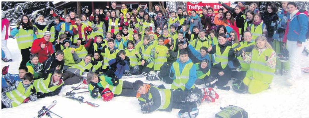
Eine erlebnis- und erfahrungsreiche Woche erlebten 79 Sechstklässler des Eichendorff-Schulverbunds in Südtirol.

Daneben lockte die hervorragende Südtiroler Küche viele Oohs, Aahs und Hmms hervor, für die es am Ende sogar Applaus gab. Zu schätzen wissen alle am Ende des Aufenthalts auch die Freundlichkeit der Südtiroler, so können alle die positiven Eindrücke mit nach Hause nehmen.