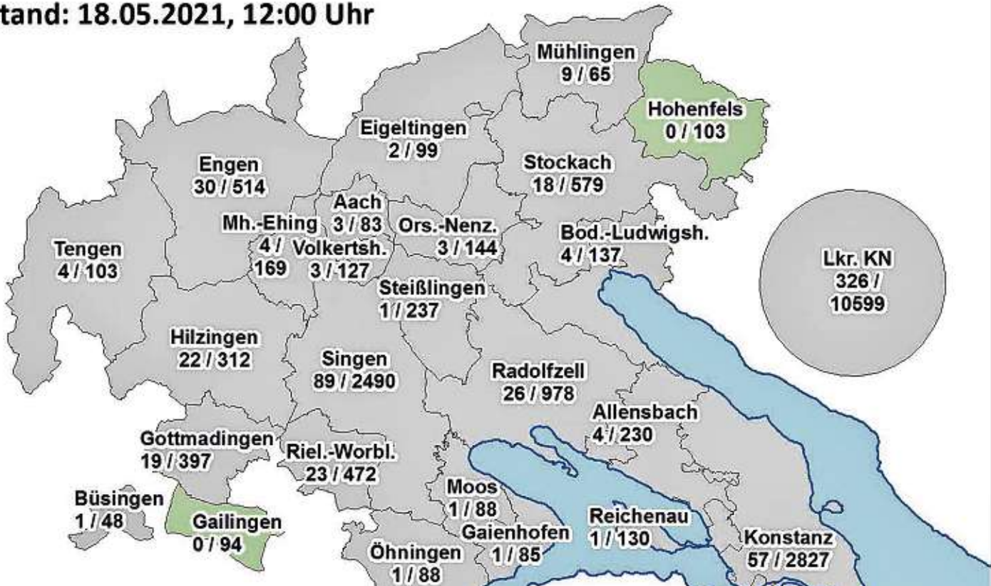
Grafik: Landratsamt Konstanz, Stand: 18. Mai 2021