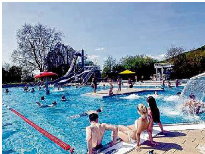
Das Gottmadinger Höhenfreibad öffnet am Samstag, 29. Mai, wieder seine Tore, zwar unter Auflagen, aber dem Badespaß steht dann nichts mehr im Wege.

Gottmadingen. Das Höhenfreibad Gottmadingen startet am Samstag, 29. Mai, unter Corona-Auflagen in die neue Saison. Die Vorbereitungen im Freibad laufen auf Hochtouren. Neben dem Hygienekonzept, gibt es auch weitere Auflagen, die einzuhalten sind.