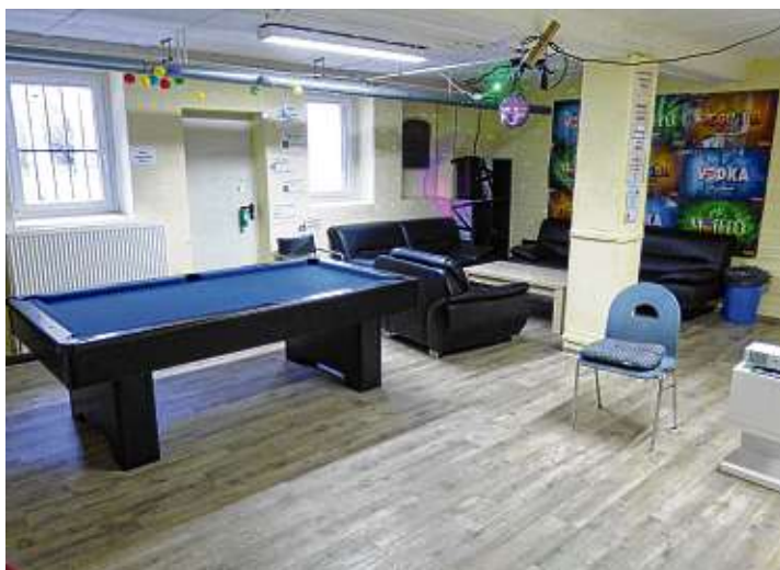
Der Jugendtreff lädt wieder herzlich ein, in seinen Räumen, unter Auflagen, mit seinen Freunden Spaß zu haben. Mehr Informationen hierzu auf Seite 3.

Die aktuellen Informationen zur Öffnung des Höhenfreibades findet man auf der Homepage des Höhenfreibades unter https://hoeohenfreibad-gottmadingen.de .