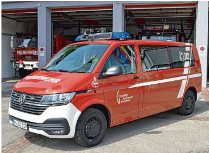
Das neue MTW ist seit Ende März einsatzbereit.

Als MTW beschafft, nach eigenen Ideen und Erfahrungen zum Führungsfahrzeug umgebaut